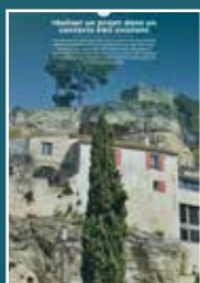
A-01 réaliser un projet dans un contexte bâti existant