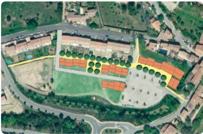
Simulation d'une extension de village : la greffe villageoise actuelle au nord, permet de prolonger facilement l'espace public de transition entre l'aire de stationnement/espace événementiel à l'est et les jardins partagés à l'ouest.