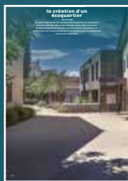
A-03 la création d'un écoquartier

Chaque intervention sur les façades de nos centres anciens compte et participe à l'harmonie du paysage urbain. Au cœur de nos villes et villages, l'intérêt particulier et l'intérêt général doivent être conjugués pour créer le cadre de vie que nous y recherchons tous.