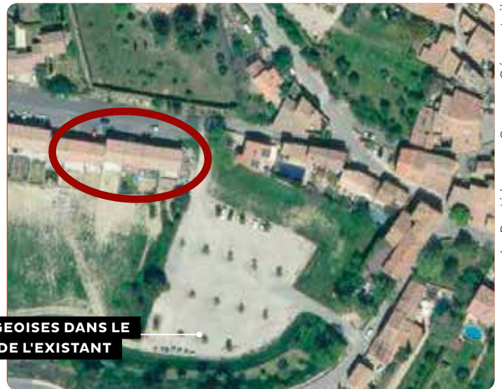
La Bastidonne