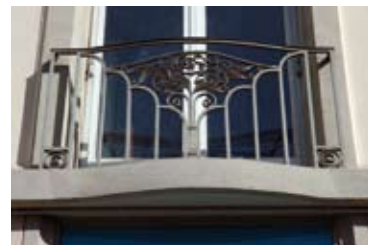
début XX e siècle