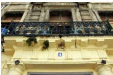
XVIII e siècle