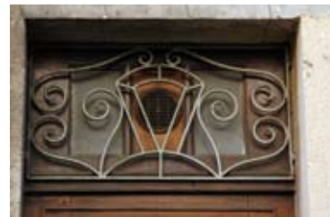
XX e siècle