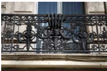
XIX e siècle