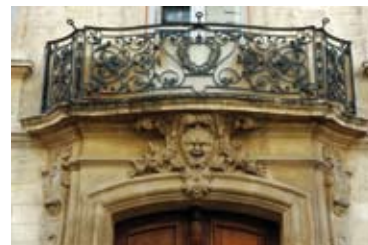
fin XVIII e siècle