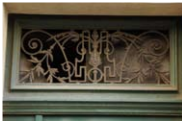
XIX e siècle