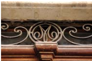
XVIII e siècle