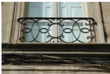
XVIII e siècle