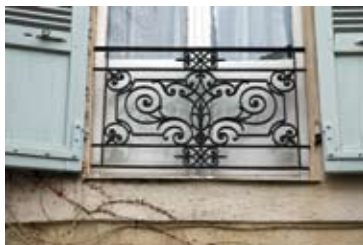
fin XIX e siècle