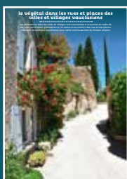
EP-04 le végétal dans les rues et places des villes et villages vaclusiens

Au cœur de nos villes et villages, l'intérêt particulier et l'intérêt général doivent être conjugués pour créer le cadre de vie que nous y recherchons tous.