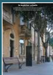
EP-02 le mobilier