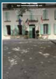
EP-03 les revêtements