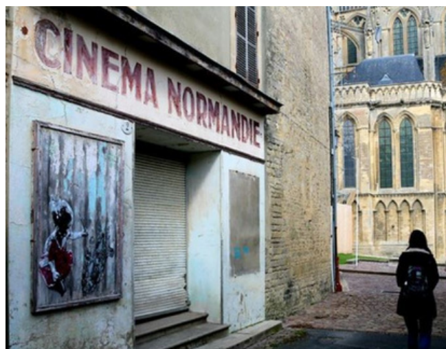
Cinema Bayeux LR