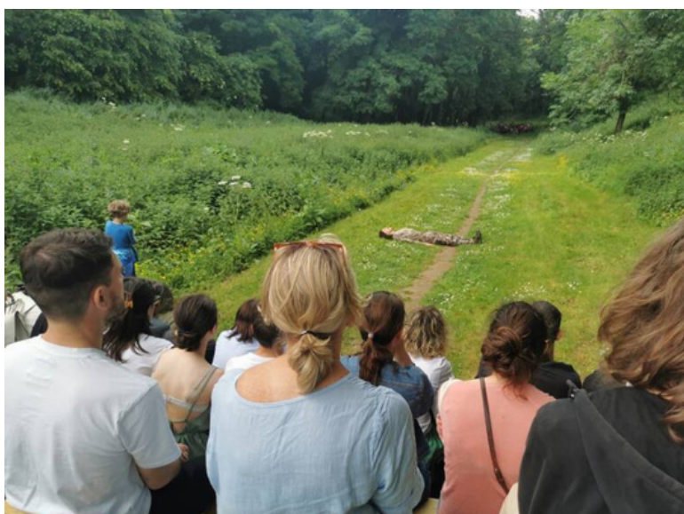
Spectacle Partout Chorège CDCN Falaise@ClaraRambaud