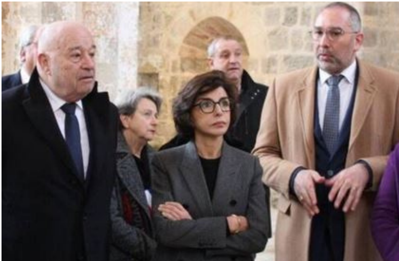
Ministre de la Culture, Rachida Dati

La ministre de la Culture, Rachida Dati, à l'Abbaye de Beaulieu en Rouergue, en Occitanie, le 22 janvier 2024, pour le lancement du "Printemps de la Ruralité".