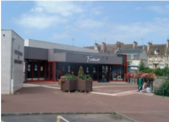
Théâtre Forum Falaise libre de droits

Dans cette perspective, la Direction régionale des affaires culturelles de Normandie organise un grand débat régional visant à questionner les modalités de participation des habitants à la vie culturelle et la présence artistique en ruralité (ingénierie, participation des habitants, présence des artistes à l'aune des transitions écologiques et énergétiques...).