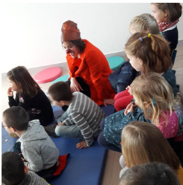
Spectacle Enfants Médiathèque de Ranes