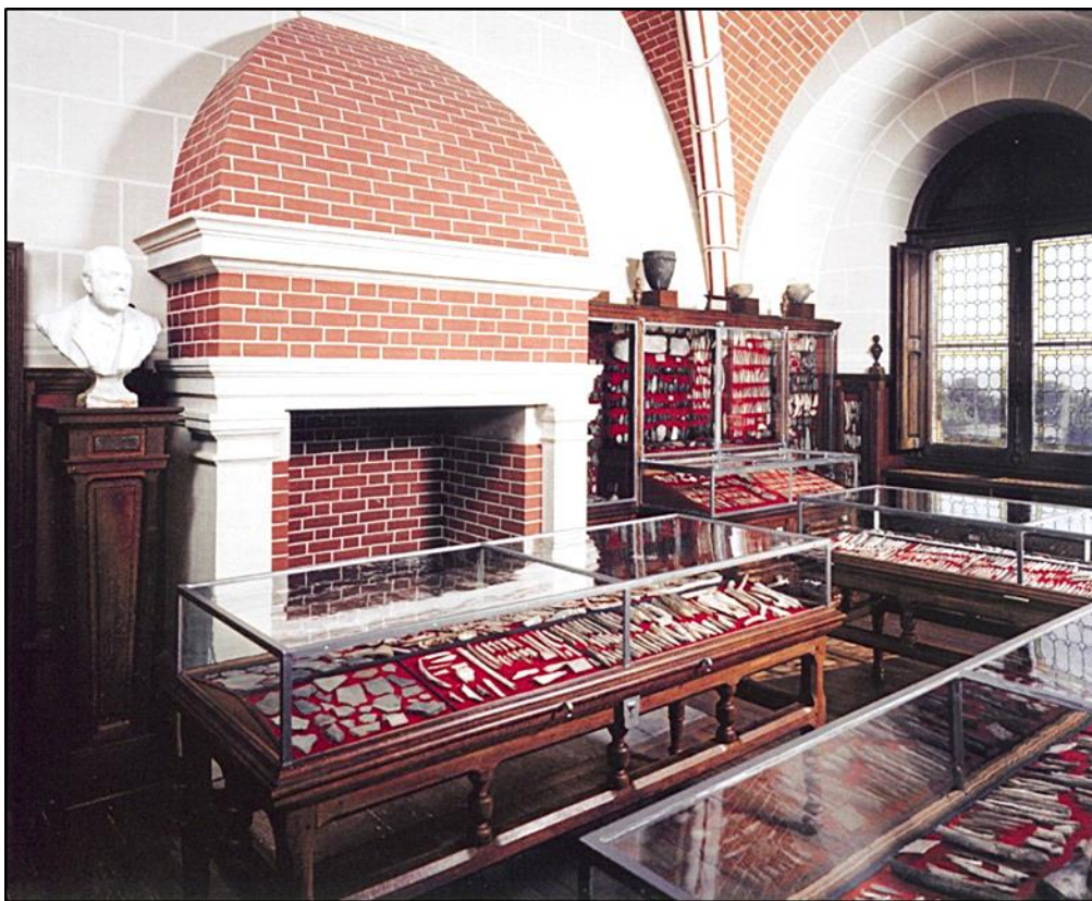
Vue de la Salle Edouard Piette côté cheminée