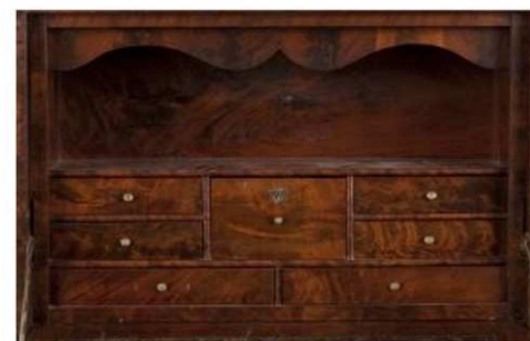
Annexe : Photographies du secrétaire (avec ses côtes en millimètre) et des modèles de caisson intérieur