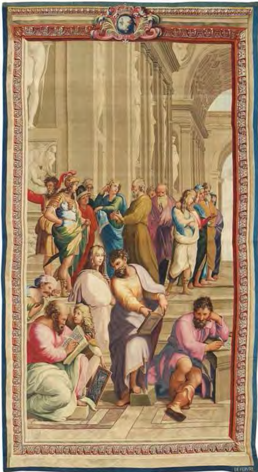
Tapissérie de lice (4,80 m x 2,66 m) d'après Raphaël, « Tenture des chambres du Vatican : l'école d'Athènes ». Entre-fenêtre des chambres du Vatican / Atelier Lefebvre (1705).