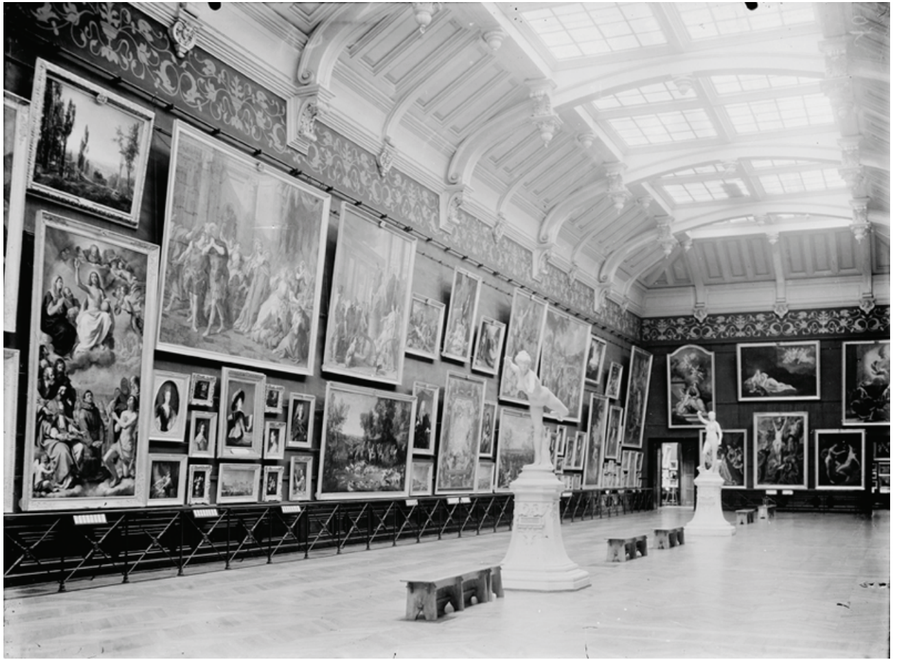
Toulouse, musée des Augustins.