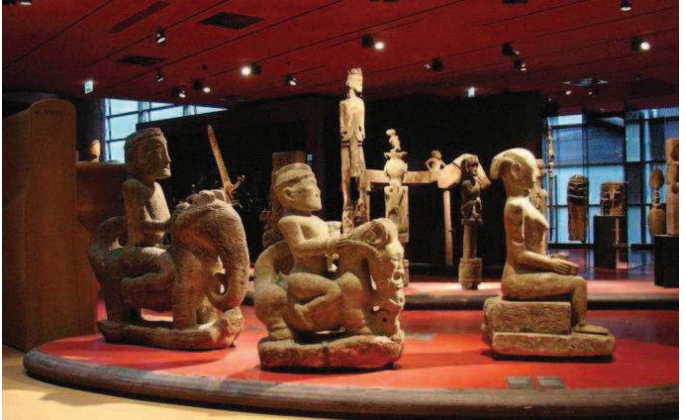
Paris. Musée du Quai Branly (musée des Arts Premiers)