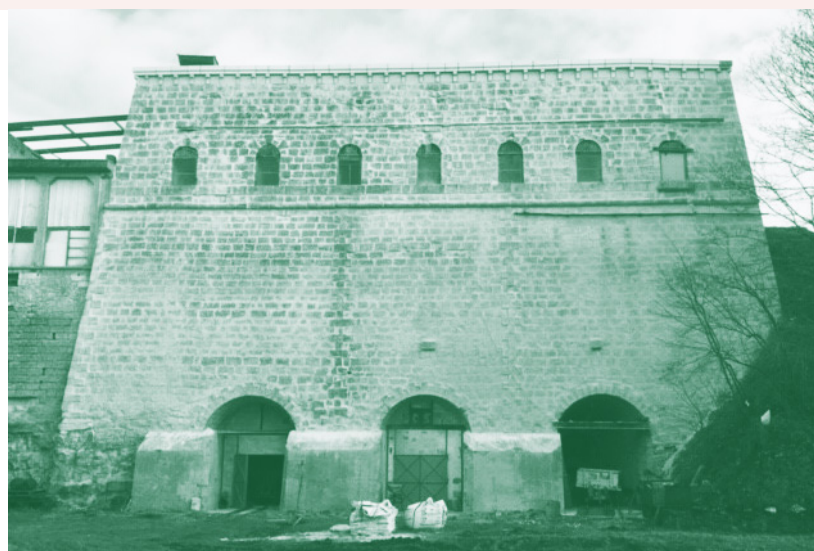
Les fours à chaux de Benet en Vendée

Les fours à chaux de Benêt sont un projet soutenu au loto du patrimoine. La DRAC a participé en complément pour permettre à l'association de réaliser une dalle en béton permettant d'assurer une couverture définitive des fours. L'Udap de la Vendée s'est fortement investie dans ces travaux