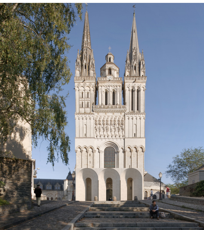
© Kengo Kuma & Associates - Image by Lautreimage

La DRAC a poursuivi l'exécution de la restauration des monuments inscrits dans la convention État-Région 2015-2020 (hors CPER) sur les sites de Guérande, Saumur, La Chapelle Launay ainsi que les grands chantiers entrepris à l'abbaye royale de Fontevraud.