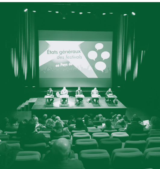
États généraux des festivals le 2 octobre 2020.

La DRAC a signé avec le Centre National de la Musique, le Conseil Régional et le Pôle de coopération des acteurs pour les musiques actuelles, un contrat de filière pour les musiques actuelles. En 2020, ont été reconduits les 3 appels à projets pour une deuxième année : « diversité musicale sur les territoires », « promotion des artistes émergents », « coopérations professionnelles ». 21 projets ont obtenu un financement pour une enveloppe globale de 90 000 €.