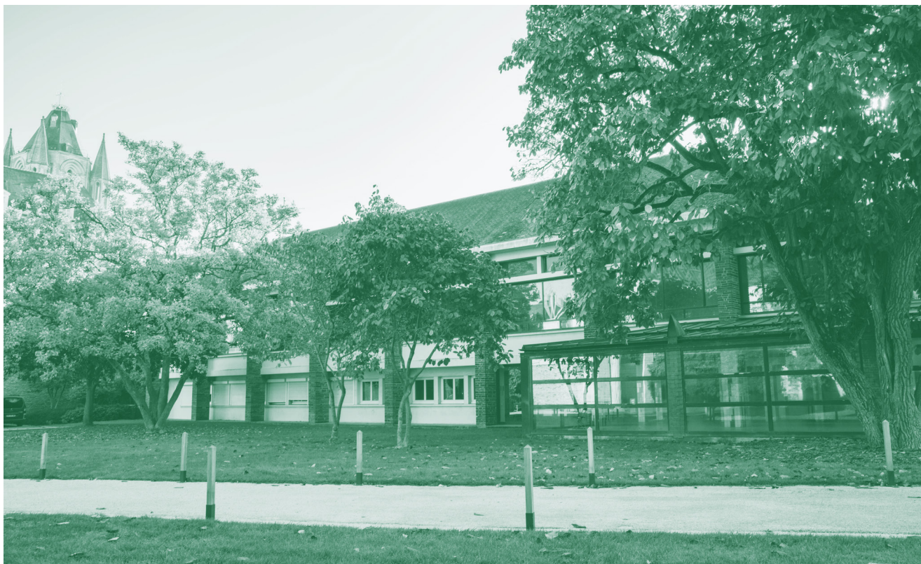
Le Repère Urbain

En 2020, les « Ville ou Pays d'art et d'histoire » en Pays de la Loire (Nantes, Guérande et le pays du vignoble nantais en Loire-Atlantique, Angers et Saumur en Maine-et-Loire, Laval et le pays Coëvrons-Mayenne en Mayenne, Le Mans, le pays du Perche sarthois et le pays de la vallée du Loir en Sarthe, Fontenay-le-Comte en Vendée) ont fait l'objet d'un soutien technique et financier de la DRAC sur une grande majorité de leurs actions pour un montant total de 163 000 €.