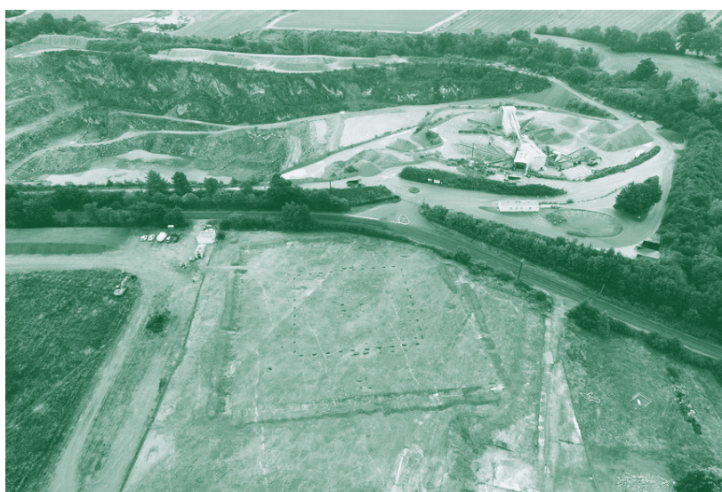
Chantier d'archéologie préventive sur le site du Pâtis à Vieillevigne (44) réalisée par le bureau d'études Eveha

La DRAC a soutenu une trentaine de projets de recherche parmi lesquels le projet collectif d'intérêt national de recherches sur l'enceinte romaine du Mans.