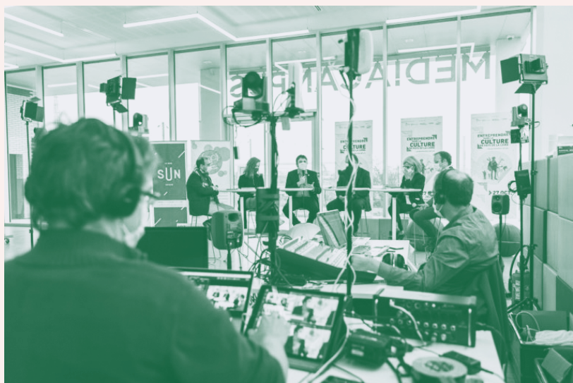
Ouverture du forum entreprendre dans la Culture

Proposé par la DRAC des Pays de la Loire, le Conseil régional des Pays de la Loire et soutenu par Nantes Métropole et la Samoa, cet événement s'adresse à tous les porteurs de projets œuvrant ou souhaitant œuvrer dans les secteurs culturels et créatifs : entrepreneurs, artistes, étudiants, enseignants, volontaires en service civique, mais aussi aux collectivités territoriales, aux structures de conseil, d'accompagnement, de financement et de service à l'entrepreneuriat.