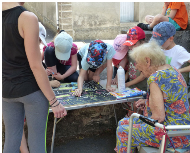
L'office de l'Utopie, Montbozon 2019

Afin de permettre à tous de suivre le déroulement des résidences, chaque binôme créera et alimentera un site/blog dédié à la résidence et produira un support de synthèse présentant leur démarche et leurs réalisations.