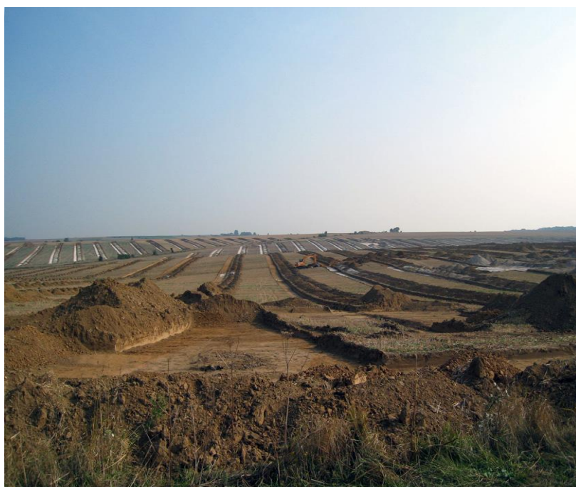
© Tranchées du Canal Seine Nord Europe, Jean-Luc Collart, Sra, 2023

Vendredi 17 et samedi 18 novembre 2023 - Hôtel Mercure Atria, Arras