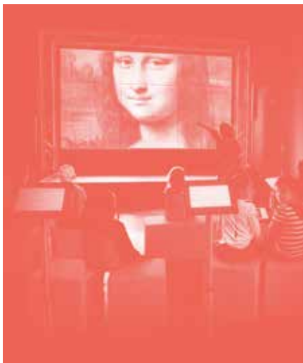
Musée numérique