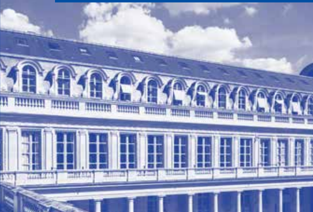
Ministère de la Culture, Palais-Royal, Paris 1 er