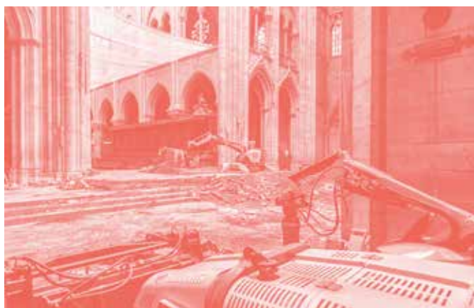
Notre-Dame de Paris

En tout, ce sont ainsi 1 milliard d'euros qui seront consacrés aux politiques patrimoniales en 2020.