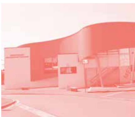
Médiathèque de Courrières (le c de copyright) D.R.

À travers le volet « Offrir plus » du Plan Bibliothèques, la conclusion de Contrats territoriaux lecture (CTL) avec les collectivités territoriales se poursuivra en 2020. 4 M€ supplémentaires y seront consacrés pour des projets associant en premier lieu les bibliothèques, les associations, les centres de loisirs, maisons de quartier, au plus près des Français.