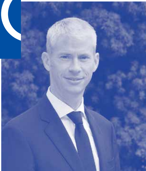
Franck Riester, ministre de la Culture

Alors que le ministère de la Culture fête ses 60 ans, la Culture est plus que jamais une composante fondamentale du projet républicain. Porteuse de sens collectif et de valeurs communes, elle est tout à la fois un enjeu de cohésion sociale et territoriale, un vecteur d'émancipation pour les citoyens, un secteur créateur d'activité et d'emplois, ainsi qu'un puissant levier d'attractivité pour notre pays.