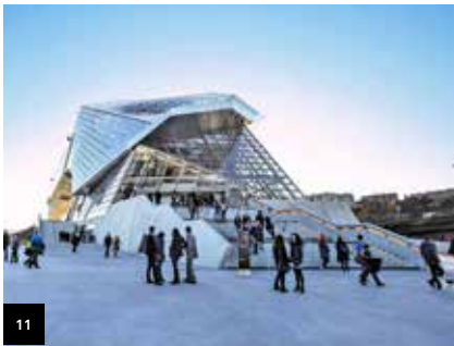
11 Page 20