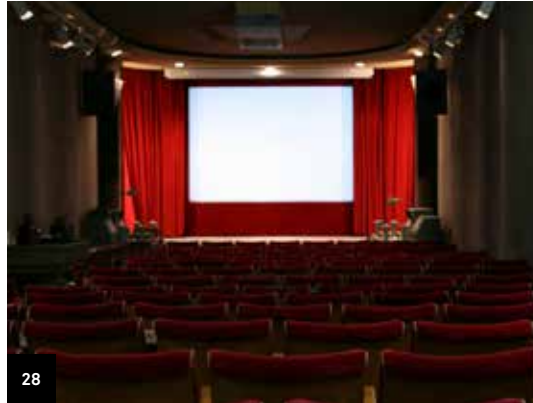
28. Paris 17 e Salle de cinéma de la cinémathèque Robert-Lynen

Démonstrations et impressions 3D, atelier de fouilles paléontologiques et quizz.