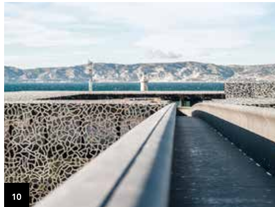
10. Marseille MuCEM, passerelle résille et toit terrasse

Le musée est installé dans un ancien fortin à canons construit sous Honoré II, prince de Monaco pour défendre la baie de Menton (1619). Jean Cocteau y travailla et prit l'initiative de le transformer en musée. Retenu en 2008 à l'issue du concours international lancé par la ville de Menton, le projet architectural réalisé par RUDY RICCIOTTI, Grand Prix national d'Architecture, accueille sur 2 700 m 2 l'ensemble des œuvres issues de la donation Séverin Wunderman. Visite libre.