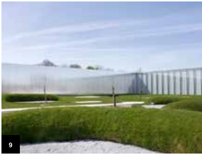
9 Page 18