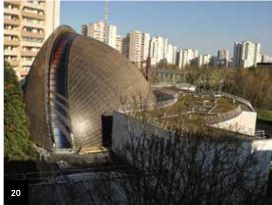
20. Créteil Cathédrale Notre-Dame © AS.ARCHITECTURE-STUDIO - Diocèse de Créteil

Visite commentée, visite libre et projection de « Boulogne au Moyen-Âge » et « L'ancienne église Notre-Dame de Boulogne ».