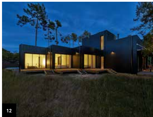
12. Lège-Cap-Ferret Villa 3 Pinsons

Conçue pour un paysagiste et son épouse, cette maison se définit comme « une machine à capturer le paysage ». Perché sur des pilotis, cet étroit volume rectiligne en bois s'intègre parfaitement au paysage. Ce dernier traverse la maison d'est en ouest grâce aux larges ouvertures des extrémités. La structure en acier donne à l'ensemble une silhouette sobre et légère qui