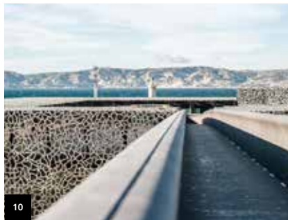
10 Page 19