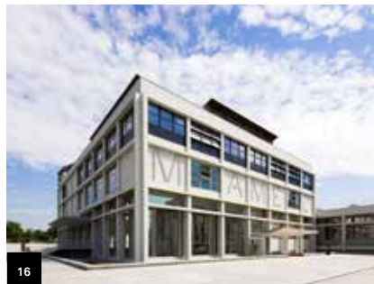
16 Page 25

9. Lens, Nord-Pas-de-Calais Musée du Louvre-Lens