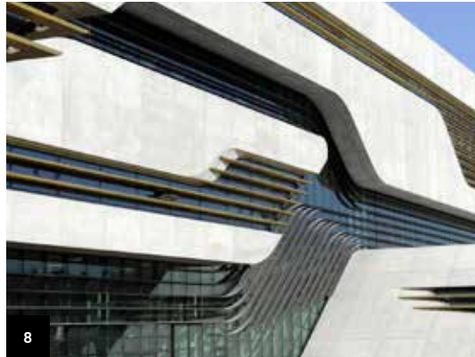
8. Montpellier Pierresvives

Ce bâtiment neuf à forte identité architecturale est signé RUDY RICCIOTTI et est dédié aux musiques actuelles. La salle de musique a été inaugurée en 2014. Visite libre et visite commentée.