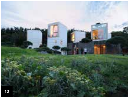
13 Page 22