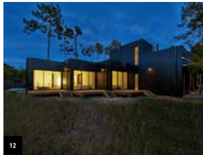
12 Page 21