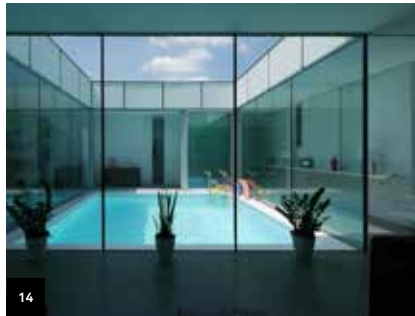
14 Page 23