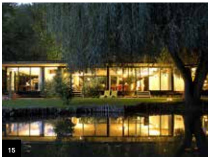
15 Page 24