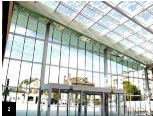
2. Troyes Nouveau campus Brossolette

Le Centre de création contemporaine (CCC) se développe avec comme ambitieux projet un Centre de création contemporaine Olivier Debré (CCCOD) qui ouvrira ses portes à l'automne 2016. Ce futur centre poursuivra à une échelle amplifiée l'action menée par le CCC depuis 30 ans. Visite commentée.