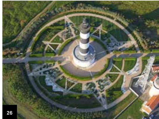
26. Saint-Denis-d'Oléron Phare de Chassiron

Désaffecté en 1984, il est remis en service en 1989. Le phare abrite aujourd'hui des expositions d'artistes locaux. Classé au titre des monuments historiques en 2011. Visite libre et exposition.