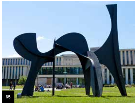
65. Université de Grenoble Alexander Calder, La Cornue © Service culture et Initiatives étudiantes

Un séminaire « Sensibilisation au dispositif 1% artistique et étude de cas » est organisé pour les professionnels en charge des œuvres du 1% artistique. Ce séminaire se tiendra à l'initiative de la direction régionale des Affaires culturelles (DRAC) Provence-Alpes-Côte d'Azur en partenariat avec les musées nationaux du XX e siècle des Alpes-Maritimes et la ville de Biot (sur inscription).