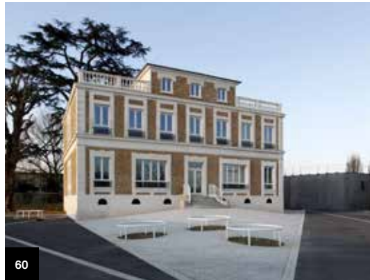
60. Guyancourt Observatoire

Depuis le XIX e siècle, plus d'une cinquantaine de monuments et d'objets ont été protégés au titre des monuments historiques sur le territoire du Pays d'art et d'histoire des Hautes Terres Corrésiennes et de Ventadour, dont une dizaine depuis le début du XXI e siècle. À travers ces exemples, la visite-conférence proposée par le service d'animation du Pays d'art et d'histoire donnera à saisir l'évolution de notre regard sur le patrimoine.