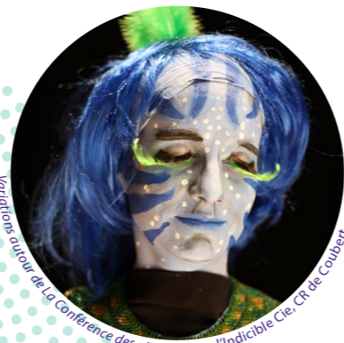
Visualisation autour de la conférence des oiseaux avec l'Indicible Cie, Ct de Coubert

« Je vole en solitaire, parfois par choix, et parfois je me surprends à imaginer un ami fidèle, qui me comprendra et suivra les battements de mon cœur. Je me nourris des pensées envolées de ceux qui n'osent plus dire ce qu'ils ressentent. Je suis à la fois fort, de par ma taille, et fragile, car j'ai dans l'âme emmurée un océan de blessures et de secrets qui me pèsent et me consomment, comme le feu argenté qui brille à travers mes plumes. » S.