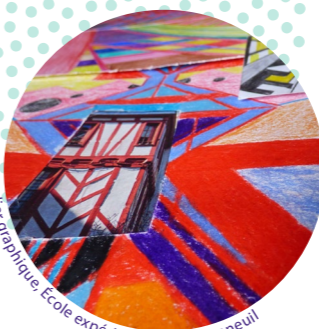
Atelier graphique, Ecole expérimentale de Bonneuil

Le label Culture & Santé en Ile-de-France valorise les établissements de soins investis dans une politique artistique et culturelle de qualité. Il est décerné par l'Agence Régionale de Santé et la Direction Régionale des Affaires Culturelles Ile-de-France dans le cadre du dispositif régional Culture & Santé*.