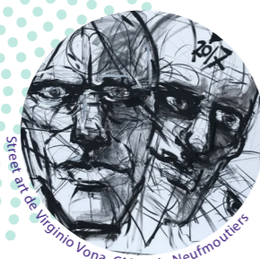
Street art de Virginio Vona, CMPA de Neufmoutiers

« Je ne pensais pas qu'on irait aussi loin. »