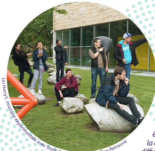
Les Harpys, musique expérimentale avec Sonic Protest, Fondation l'Élan Retrouvé

« Je vole en solitaire, parfois par choix, et parfois je me surprends à imaginer un ami fidèle, qui me comprendra et suivra les battements de mon cœur. Je me nourris des pensées envolées de ceux qui n'osent plus dire ce qu'ils ressentent. Je suis à la fois fort, de par ma taille, et fragile, car j'ai dans l'âme emmurée un océan de blessures et de secrets qui me pèsent et me consomment, comme le feu argenté qui brille à travers mes plumes. » S.