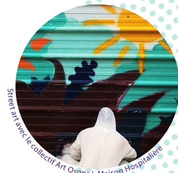
Street art avec le collectif Art Osons !, Maison Hospitalière