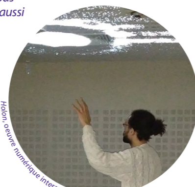
Hôpital œuvre numérique interactive, CH de Melun-Sénart

« Je ne pensais pas qu'on irait aussi loin. »