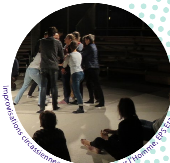
Improvisations circassiennes avec Un Loup pour l'Homme, EPS Erasme

« C'était à Nice, ma ville natale. L'été, besoin de personnel dans une vieille maison de retraite sur les hauteurs, dans les beaux quartiers. J'étais très jeune, premier job, première fois, premiers gestes, premiers pas dans la vraie vie. J'allais avoir un peu d'argent, chez moi c'était la dèche... Première toilette : dame frêle, eau bien chaude à portée de main. J'ai horreur d'avoir froid dans la salle de bain. Bien que ce fût l'été, j'avais peur qu'elle ait froid. Alors, j'ai commencé tout doucement par le visage, les mains, le buste... Elle m'a dit à voix basse : « C'est bon, c'est bon, c'est chaud, humm ! Ça fait longtemps que cela n'a pas été aussi chaud... ». J'ai écarquillé les yeux, ai senti la chaleur me traverser moi aussi. Je me suis dit : « je veux être aide-soignante, avoir mon diplôme et ne pas être payée au lance-pierre ». Je m'en souviens comme si c'était hier. Pourtant, je ne sais plus son nom. Elle avait cent ans. J'en avais dix-huit. » L.V.