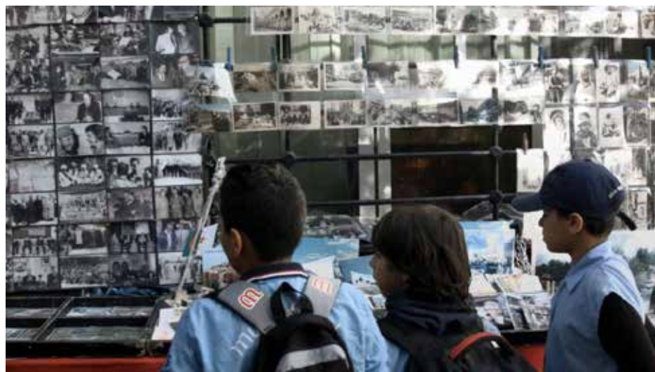
Still du film Le Roman algérien