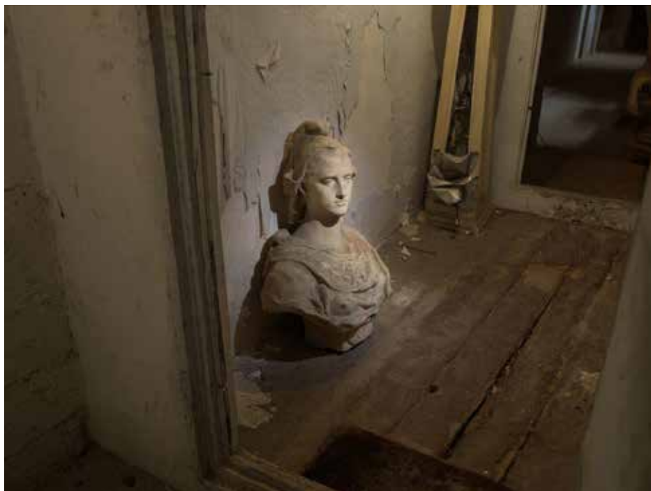
Cave - Hôtel du Préfet de l'Orne, Alençon

À la demande de la Direction régionale des affaires culturelles de Normandie et de l'Association régionale pour la diffusion de l'image (Ardi-Photographies) à Caen, j'ai exploré pendant deux ans les trois logements de fonction des préfets de Basse-Normandie, patrimoine national dont l'accès est interdit au public. Partout, de longs couloirs, des salons d'apparat, des odeurs de boiseries, de meubles anciens, et le craquement indiscret du parquet ; partout, un personnel consciencieux occupé à repasser, servir, cuisiner, entretenir des bâtiments classés, souvent splendides.