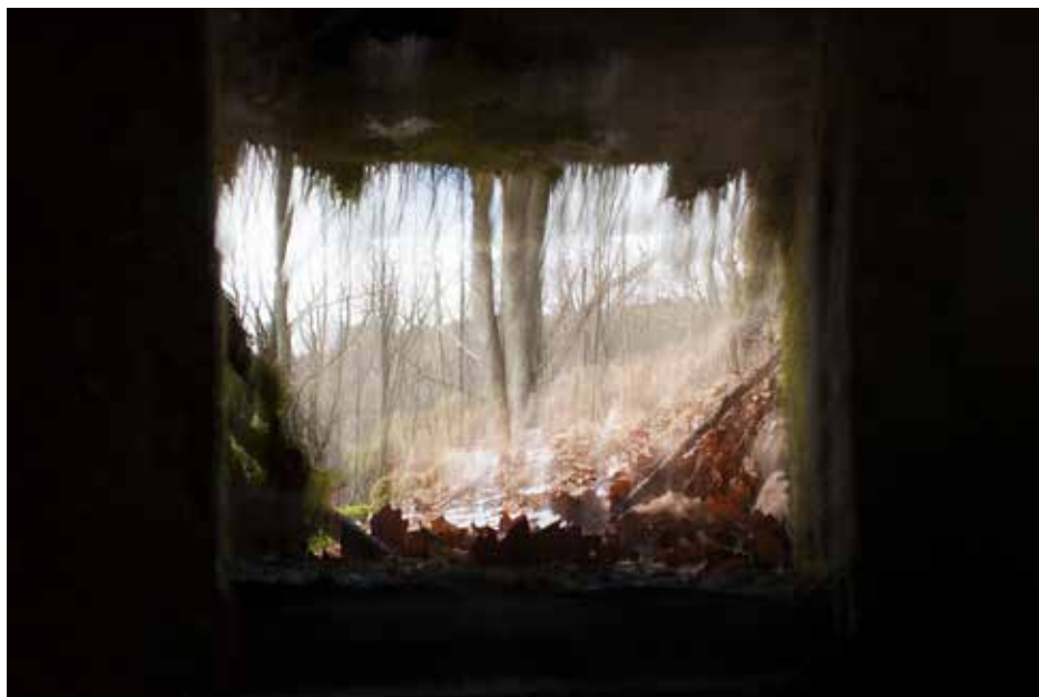
Hartmannswillerkopf, Vosges - 2017