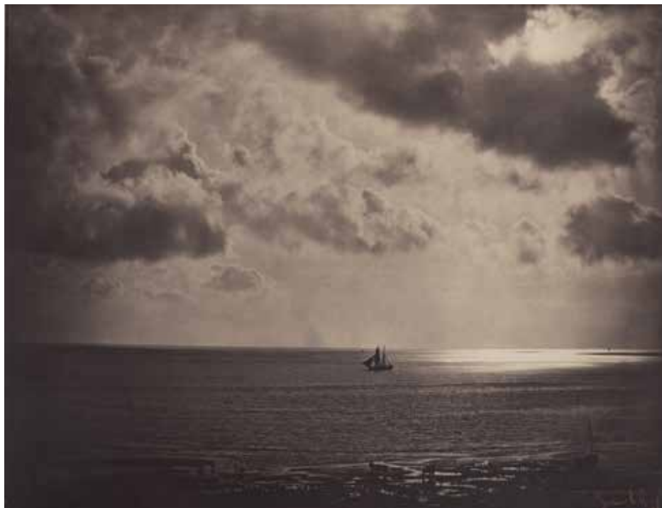
Gustave LE GRAY (1820-1882), Le brick au clair de lune, 1856.

Le musée Condé de Chantilly présente la remarquable collection de photographies de la seconde moitié du XIX e siècle réunie par le duc d'Aumale. Cette collection, qui compte plus de 1 900 pièces, comprend des œuvres d'artistes célèbres appartenant à la génération des « Primitifs » de la photographie : les célèbres marines de Gustave Le Gray (1820-1884), les vues des Alpes des frères Braun ou encore les photographies d'actualité de Robert Howlett, les premières photographies d'amateur et les prémices de la photographie industrielle. On relève les noms d'autres artistes liés à la Mission héliographique de 1851, notamment celui d'Édouard-Denis Baldus (1813-1882), dont le musée Condé conserve trois tirages réalisés vers 1885 représentant des vues de Paris. D'autres vues de monuments parisiens sont dues aux frères Bisson. Passionné de montagne, le duc d'Aumale possède aussi de grandes vues de Suisse par Adolphe Braun (1812-1877) à Dornach. Militaire, il acquiert le premier grand reportage de guerre dû à Roger Fenton, envoyé au siège de Sébastopol en 1854 par la reine Victoria. La collection conserve encore des portraits de famille, de la famille d'Orléans à la famille de Habsbourg à laquelle la duchesse d'Aumale était apparentée par sa mère, et des photographies de tableaux et d'objets d'art montrant que le collectionneur avait un usage documentaire de ce médium.