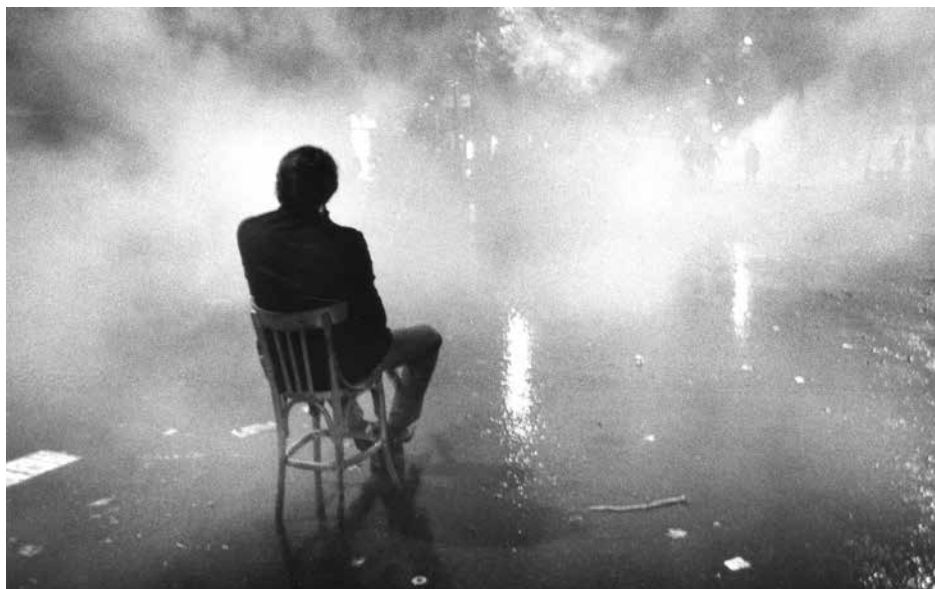
Bd St Michel Paris 5e, 24 mai 1968