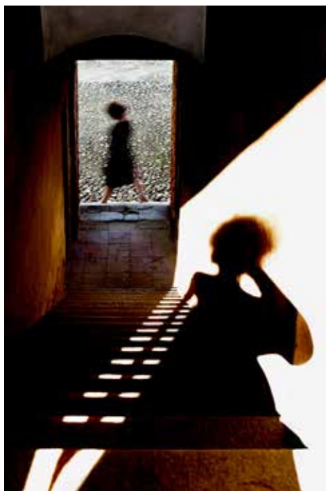
La trama (I), Dans le miroir des rizières (Maria), 2016