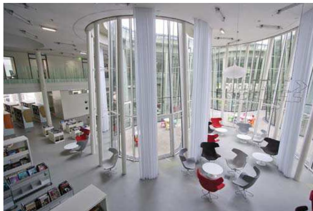
Médiathèque du Marsan

Elle fait partie intégrante du contrat territoire-lecture et doit être validée par le comité de pilotage.