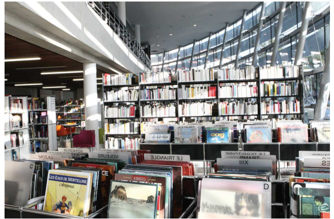
Médiathèque Boris Vian de Chevilly-Larue

Au sein des collectivités, le portage des projets est en général confié à la bibliothèque. Les bibliothèques territoriales et les associations de développement de la lecture sont les principaux bénéficiaires des contrats territoire-lecture.