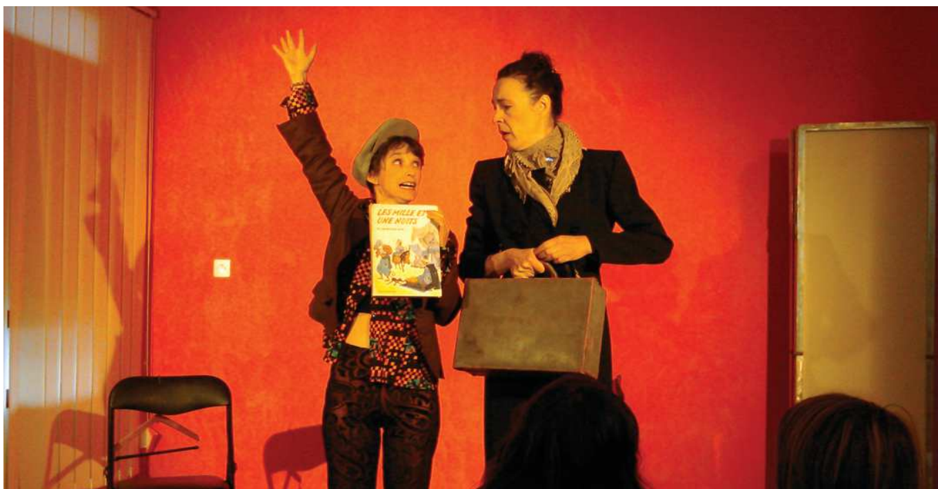
Spectacle «Les Mille et une nuits ou la Métamorphose du Sultan», par la Compagnie 3m33

Portail du Réseau des Bibliothèques de Bresle Maritime : http://bibliotheques.breslemaritime.fr