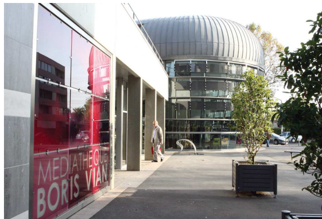
Médiathèque Boris Vian de Chevilly-Larue

Les contrats territoire-lecture sont pluriannuels. Leur durée optimale est de 3 ou 4 ans. L'étape de réalisation de l'état des lieux et d'élaboration du programme peut être, ou non, incluse dans le déroulement de la convention.