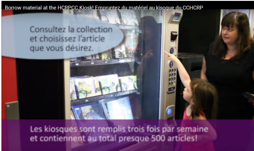
↑ Distributeur dans un centre communautaire (bibliothèque publique d'Ottawa - Canada)