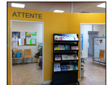
↑ salle d'attente d'un centre de santé