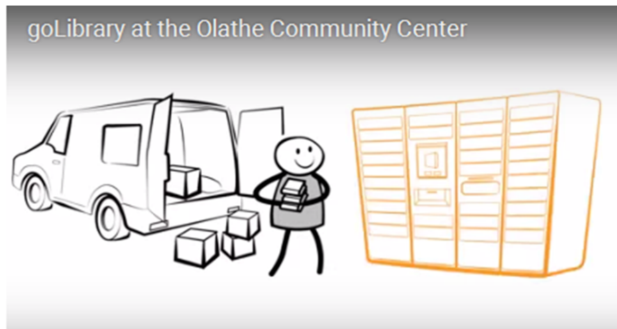
↑ Casiers (bibliothèque publique d'Olathe – Kansas – USA)