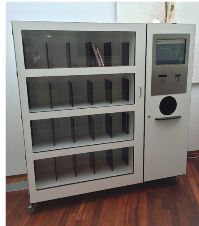
↑ «Bibliothèque mobile» commercialisée par Nedap