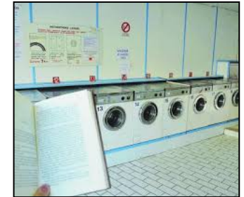
↑ «Bookcrossing / Lire au Havre