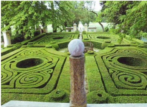
Castelnau-d'Audary. Château du Castelet des Crozes, jardin

Édifice commandé par Louis XIV en 1696. La cathédrale s'inscrit dans la typologie des églises classiques issues de la Contre-Réforme. Trois architectes du roi dont Jules Hardouin-Mansart ont suivi le chantier. Édifice emblématique de la foi catholique au cœur d'une ville protestante. Les collections du trésor ont été constituées par le chanoine Fernand Pottier (1838-1922), archiprêtre de la cathédrale de Montauban, président-fondateur de la Société archéologique et historique de Tarn-et-Garonne en 1866. Les objets présentés ont fait l'objet de travaux de conservation ou de restauration. Ces prestigieuses collections sont pour la plupart protégées au titre des monuments historiques. Visite guidée des combles de la cathédrale en compagnie de l'Architecte des bâtiments de France et de l'ingénieur du patrimoine, dim à 14h30 et 16h30. Visite guidée du trésor par la conservatrice des monuments historiques dim à 14h30 et 15h30 (visites sur inscription obligatoire au 05 63 63 03 50 à partir du 5 sept). Gratuit.