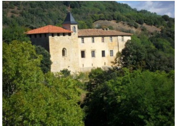
Crampagna. Château