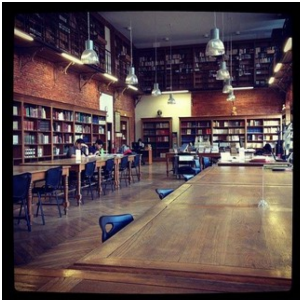
Toulouse. Bibliothèque d'Étude Méridionales

Au début de 1659, les consuls de Moissac proposent aux Doctrinaires, installés à Toulouse, de fonder un collège pour l'éducation de la jeunesse. Les travaux de construction s'achevèrent à la fin de l'année 1660. Pendant la Révolution, le collège fut fermé et les bâtiments servirent de lieu de réclusion pour les suspects et de logement pour les gendarmes. La chapelle servait au culte de la déesse Raison. En 1826, le collège fut rendu à l'enseignement et la chapelle devint église paroissiale du quartier. Visite guidée dim à 11h, 14h, 15h30 et 17h (sur inscription au 05 63 05 08 05). Gratuit.