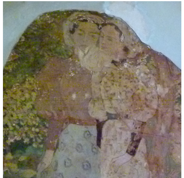
Banyuls-sur-Mer. Détail peinture attribuée à Maillol dans la salle à manger