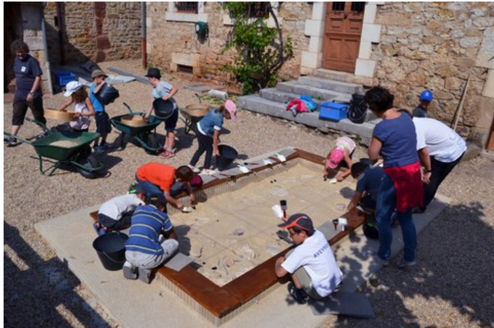
Montrozier. Espace archéologique départemental, initiation à la fouille archéologique

Chasses au trésor pour les 5-8 ans, dim : 10h-12h, pour les 9-12 ans, dim : 15h-16h30. Gratuit.