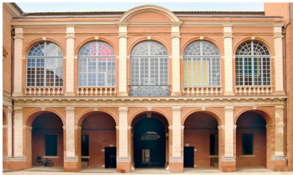
Hôtel des Chevaliers de Saint-Jean de Jérusalem