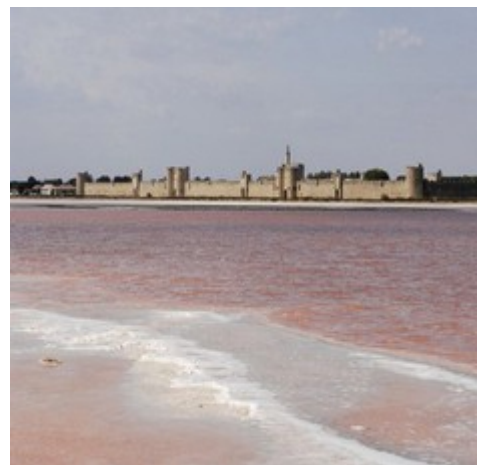
Aigues-Mortes. Remparts