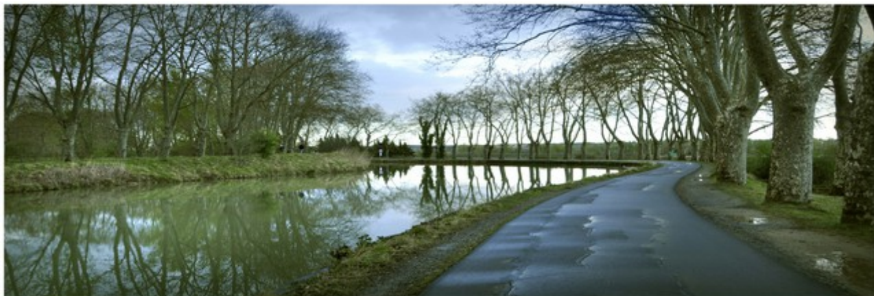
Canal du Midi

Dans le cadre de la célébration des 350 ans du Canal du Midi, les visites et animations qui ont été organisées sont particulièrement mises à l'honneur.