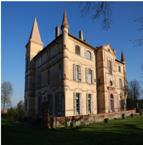
Bonrepos-Riquet. Château © M. Feuillaquie

Exposition sur le canal du Midi, les vignes, les caves, les vieilles bâtisses, approche littorale, influence méditerranéenne. Sam : 10h-18h30, dim : 10h- 12h, 13h30-17h. Gratuit.