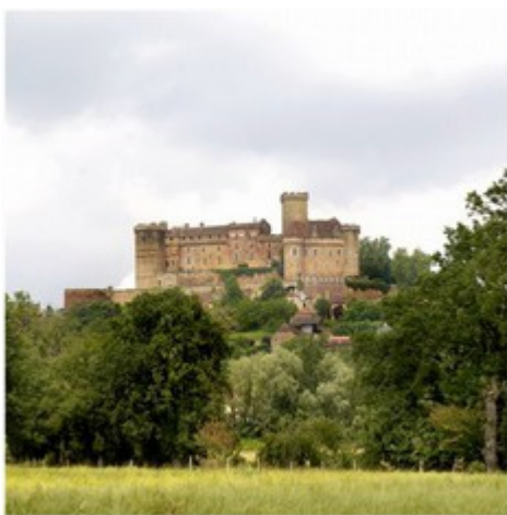
Prudhomat. Château de Castelnau-Bretenoux

Il se présente comme un ensemble de constructions disposées en équerre. La branche nord est occupée par le château primitif du XIII e siècle, constitué par un corps quadrangulaire épaulé d'une tour carrée. L'aile Renaissance, sur plan classique, est constituée d'un corps central quadrangulaire, encadré de deux pavillons. Le château est entouré de jardins d'inspiration Renaissance. Sam et dim : 10h-12h30, 14h-17h30, visite libre des jardins, visite guidée du château. Gratuit.