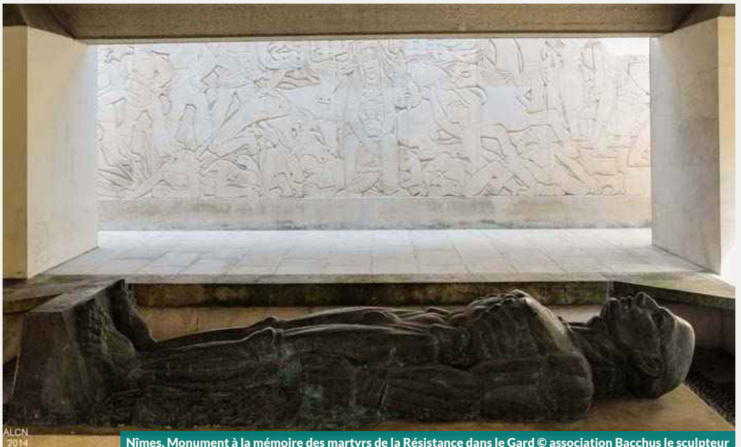
Nîmes. Monument à la mémoire des martyrs de la Résistance dans le Gard © association Bacchus le sculpteur

Parmi les éléments remarquables de l'hôtel particulier, on observe les fragments de sarcophages paléochrétiens insérés dans le mur du passage d'entrée. Découverte de la cour intérieure dim 9 h-18 h