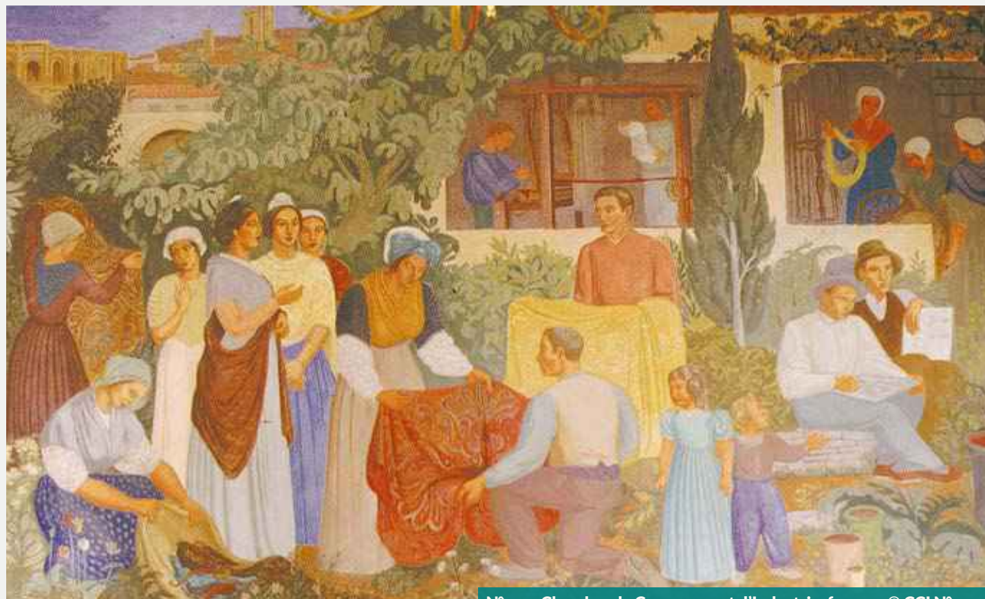
Nîmes. Chambre de Commerce et d'Industrie, fresque

Situé au sommet de la colline Saint-Vincent, il domine une vaste plaine où se rejoignent les vallées de la Tave