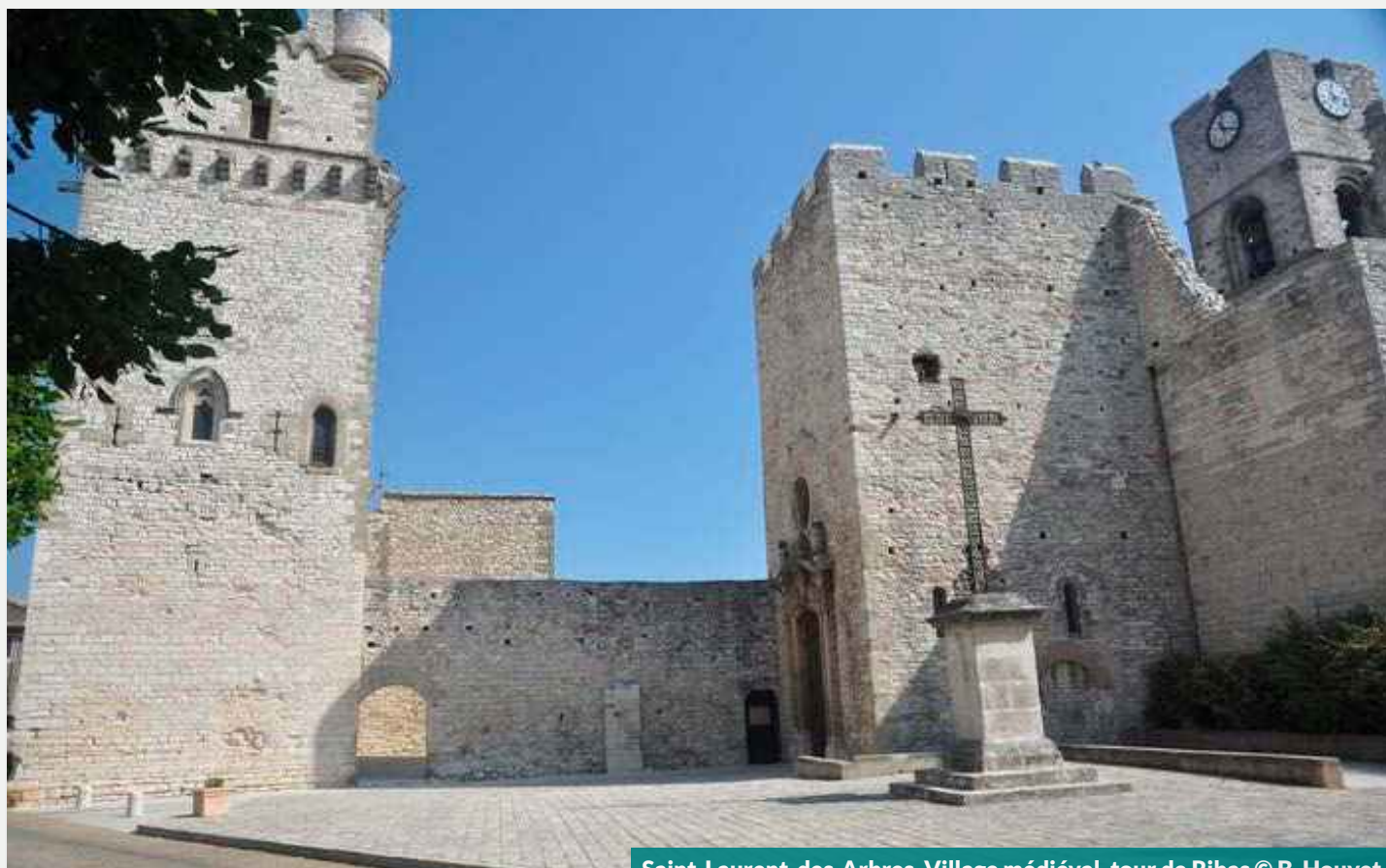
Saint-Laurent-des-Arbres. Village médiéval, tour de Ribas