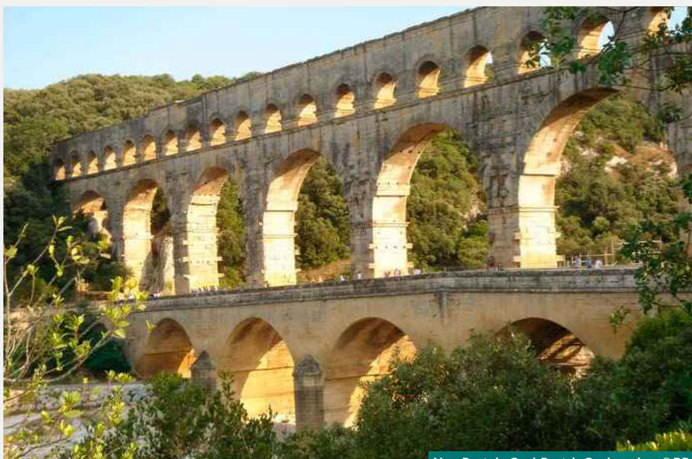
Vers-Pont-du-Gard. Pont du Gard, garrigue