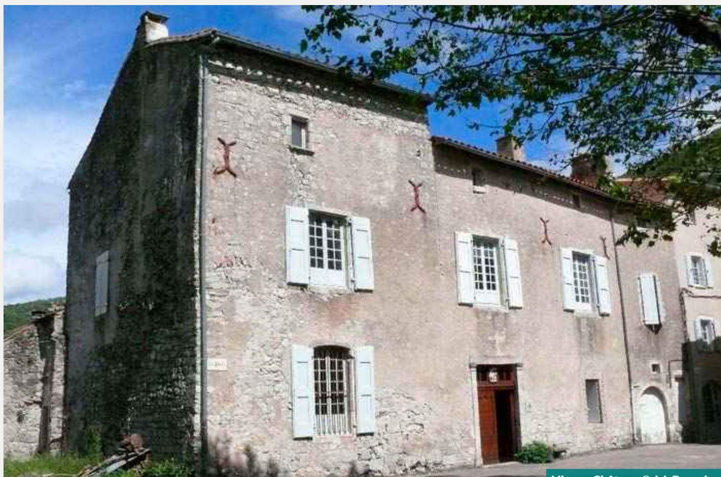
Vissec. Château

Aménagé sur une construction existante, le domaine est pillé à la Révolution et vendu comme Bien national. Le portail rectangulaire est souligné par des moulures simulant des chapiteaux doriques. Visites guidées sam 15h30-18h30