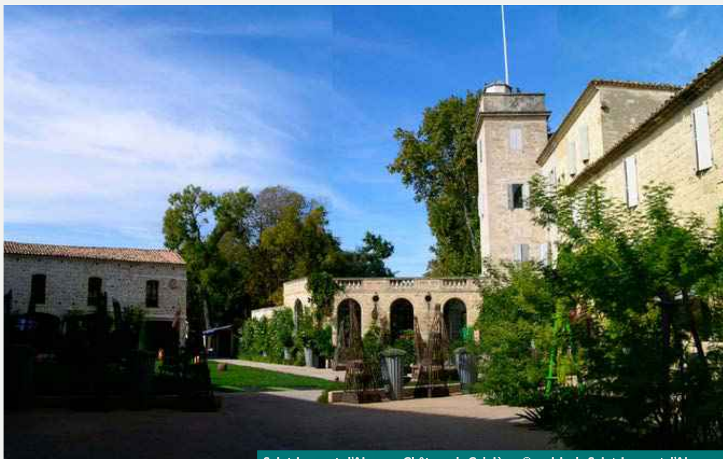
Saint-Laurent-d'Aigouze. Château de Calvières

Construction confiée en 1920 au maître maçon Ludovic Trouchaud. Visites guidées sam et dim 9h30-10h30, rendez-vous maison du tourisme : 04 66 88 17 00