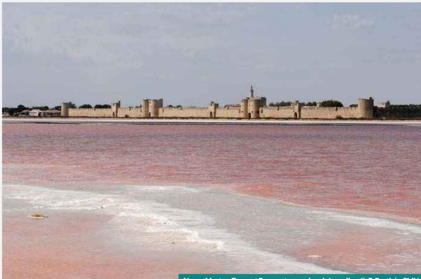
Aigues Mortes. Tours et Remparts, vue depuis les salins

Monument fortifié à double corps datant de la fin du XIII e siècle. Son activité principale était de moudre le blé au moyen de roues verticales mues par le Vidourle sam et dim 12 h-19 h : 04 66 80 89 00