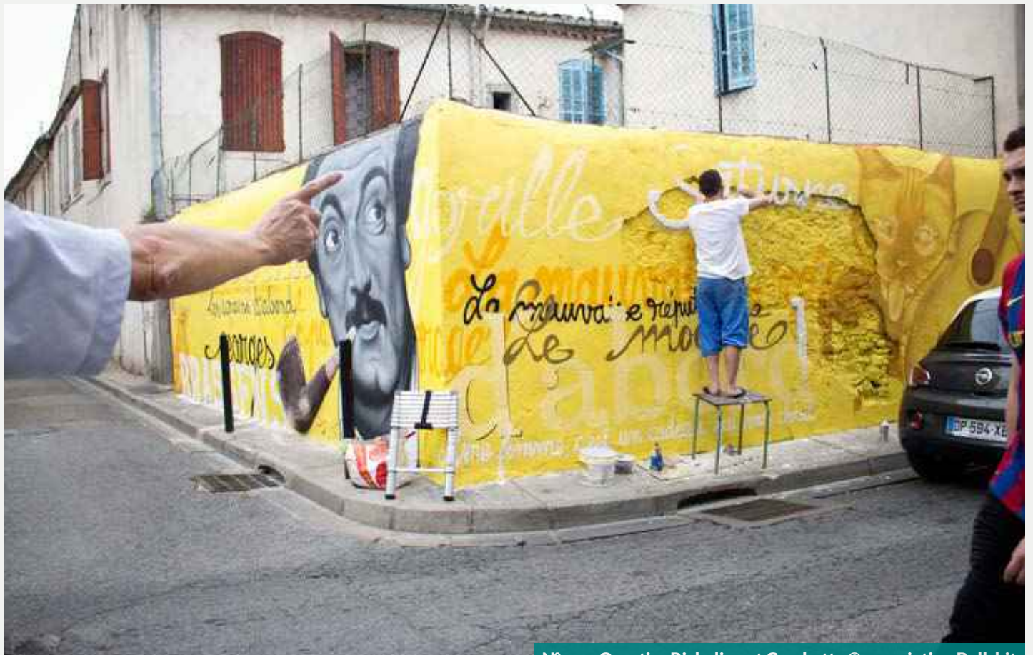
Nîmes. Quartier Richelieu et Gambetta

Édifice de style néo-roman construit en pierre de Pompignan (marques de bâtisseurs et poinçons de tailleurs de pierre) sam 10h-18h et dim 10h 30-17h 30