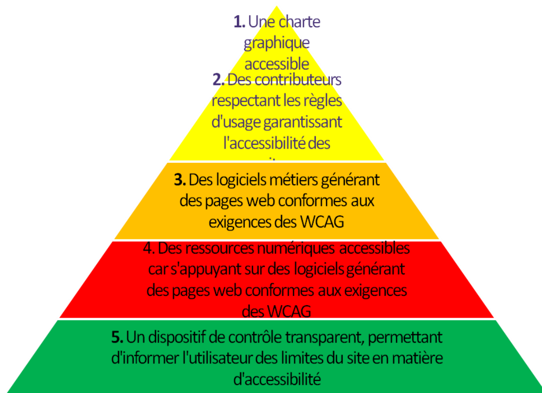
Schéma présentant une vision globale de la démarche et d'introduire sa présentation, in Bibliothèques accessibles ( www.bibliothequesaccessibles.fr ).

En pratique, l'accessibilité du site dépend de 4 facteurs. Il faut :