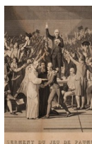
Chroniques de papier