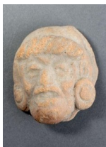
Collection précolombienne de Chabrand