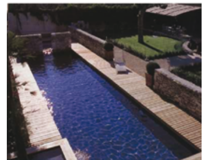
Margelle bois et liner sombre