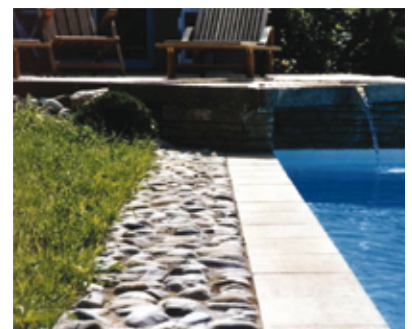
Pierres et galets

Les matériaux naturels et traditionnels sont préférables (matériaux s'apparentant à la pierre locale, dalles de pierre, gravier, bois etc...). Cependant, ils peuvent être préfabriqués (béton revêtu, pierres reconstituées ou construites en pierre de pays, en briques posées sur chant ou en carreaux de terre cuite etc...). Il faut privilégier une unité de coloration en évitant les teintes trop claires.