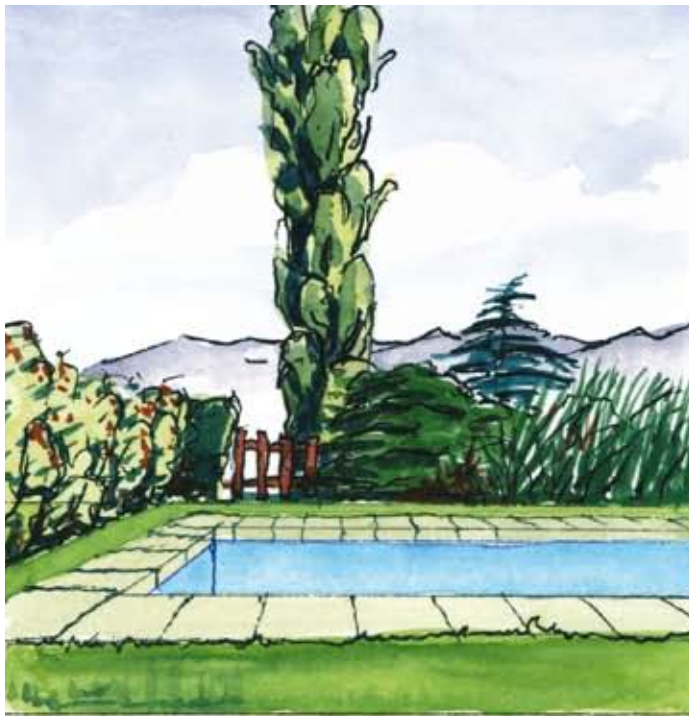
Avec liner bleu ou blanc