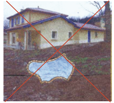
Forme de bassin à proscrire

Ils doivent privilégier les tons sombres et d'aspect mat. Selon la teinte du revêtement, l'eau prendra une teinte différente (ex : un liner blanc ou bleu donnera une eau d'un bleu peu naturel). En effet, le bleu azur a un impact très fort dans le paysage. La piscine dans son environnement doit être un miroir d'eau qui reflète la nature.