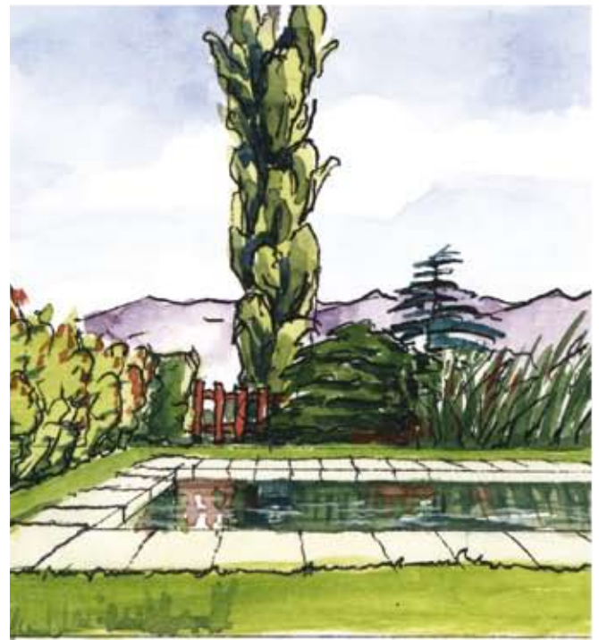
Avec liner de teinte sombre