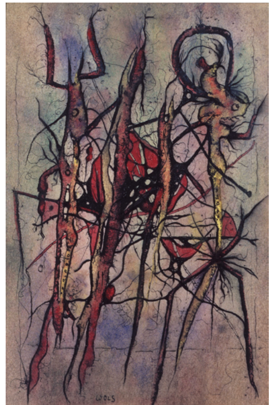
Wols (Alfred Otto Wolfgang Schulze, dit) Sans titre 1943-1944, aquarelle et encre de Chine sur papier, 18,4 x 12,5 cm, Musée de Valence, art et archéologie