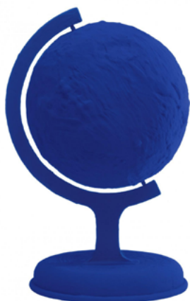
Yves Klein Globe terrestre bleu (RP 7) Édition posthume de 1988, pigment pur et résine synthétique sur plâtre, 36 x 21,5 x 19,5 cm Collection particulière © Succession Yves Klein c/o ADAGP, Paris, 2023