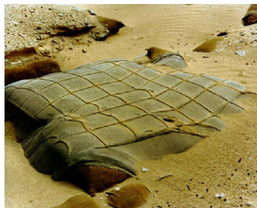
Sophie Ristelhueber Fait #46, de la série « Fait » 1992, édition 2/3 de 1995, tirage couleur à développement chromogène contrecollé sur aluminium, 100 x 125 cm Paris, Maison Européenne de la Photographie © Sophie Ristelhueber