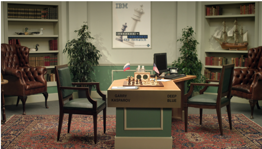
Fabien Giraud & Raphaël Siboni 1997 - The Brute Force ( The Unmanned , saison 1, épisode 2) 2014, vidéo HD, 26' Collection des artistes © Fabien Giraud & Raphaël Siboni

Dans le domaine artistique, on peut trouver des évocations poétiques et caustiques des robots. Ceux-ci apparaissent bien souvent comme des êtres de substitution comme les grandes silhouettes anthropomorphes signées Gloria Friedmann, faites de câbles et de matériel informatique. Chez Patrick Tresset, on assiste au transfert de l'activité créatrice elle-même de l'humain vers la machine, laquelle observe le motif d'un œil artificiel et le représente avec un bras articulé. Enfin, dans une perspective historique beaucoup plus large, le binôme Fabien Giraud et Raphaël Siboni réalise une vaste fresque de vidéos baptisée The Unmanned [L'inhabité] qui retrace et anticipe des épisodes de basculement technologique dans le cours humain, comme celui où, par la simple force brute d'un algorithme, un robot a battu pour la première fois l'intelligence du plus grand joueur d'échec au monde, Garry Kasparov en 1997.