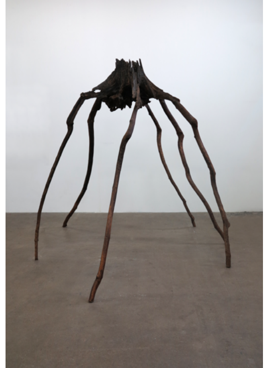
Cécile Beau & Anna Prugne La Siouva 2017, souche, branches, 260 x 300 cm Collection des artistes © Cécile Beau - Artais