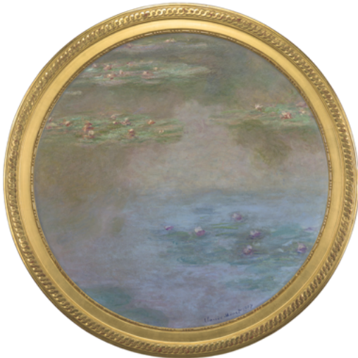
Claude Monet Nymphéas 1907, huile sur toile, diam. 80,7 cm Saint-Étienne Métropole, Musée d'art moderne et contemporain

Même avec un filtre esthétique, il est vrai que songer à l'Univers sans l'Homme a quelque chose d'inquiétant. Dans un contexte de menace écologique et technologique, il est devenu naturel de s'imaginer l'espace demeurant sans notre espèce, ce qui produit une impression d'absurde voire de crise existentielle. Mais les artistes ne s'arrêtent pas à cet échec. Ils œuvrent à nous arracher aux paralysies (et au conformisme) du sentiment apocalyptique. Ils matérialisent des fractions de cosmos dont le statut oscille entre l'inaccessible et la promesse : depuis les milieux sous-marins de Gilles Aillaud jusqu'aux galaxies lointaines abstractisées par Anna-Eva Bergman ou Hans Hartung. Ces fractions qui étaient là avant nous, le seront aussi après, et si elles s'entrouvrent à notre perception, juste un peu, elles s'offrent par ailleurs à d'autres que nous-mêmes.