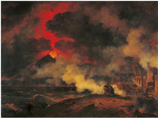
Pierre-Henri de Valenciennes Éruption du Vésuve arrivée le 24 août de l'an 79 de J.-C. sous le règne de Titus 1813, huile sur toile, 148 x 196 cm Toulouse, Musée des Augustins

De façon étonnamment contemporaine, Lisbonne est meurtrie par un terrible séisme en 1755 tandis que l'Europe découvre les sites archéologiques enfouis de la baie de Naples disparus depuis l'an 79. Ces deux chocs sont des sujets picturaux spectaculaires et renforcent la vogue pour le « sublime » des tableaux de catastrophe et des scènes de ruines dont Hubert Robert est le grand maître. De nombreux artistes comme Philippe-Jacques de Loutherbourg ou Pierre-Henri de Valenciennes se plaisent à montrer l'Humanité, que ce soit à l'échelle individuelle ou collective, en victime des forces mécaniques de la nature, laquelle est indifférente à sa présence et à sa destinée sur Terre.