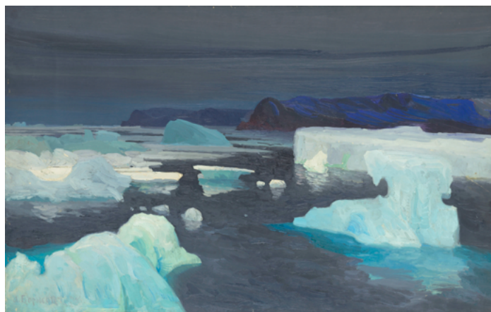
Alexandre Sergejewitsch Borisoff Les Glaciers, mer de Kara 1906, huile sur toile, 79 x 124 cm Paris, Musée d'Orsay