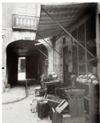
Eugène Atget Passage conduisant à la rue Vieille-du Temple 6 rue des Guillemites (4 e arr) 1911, tirage sur papier albuminé, 21,5 x 17,8 cm Musée Carnavalet, Histoire de Paris © Paris Musées / Musée Carnavalet - Histoire de Paris