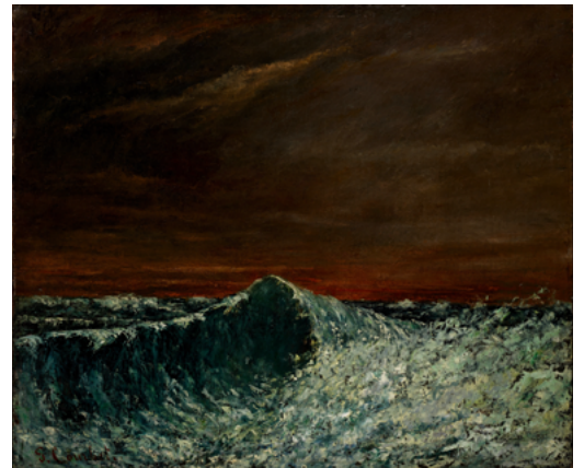
Gustave Courbet La Vague Vers 1871-1873, huile sur toile, 55 x 65 cm Collection de Bueil & Ract-Madoux, Paris

« L'univers sans l'homme » est une expression de Charles Baudelaire (1821-1867). Elle est issue d'un texte de 1859 alors qu'il visite le Salon de peinture et qu'il déplore la façon dont les courants dits « réalistes » deviennent dominants. Il parle aussi de « nature sans l'homme ». Le problème est double pour Baudelaire : de tels courants se focalisent selon lui sur des motifs banals ; de surcroît, ils se contentent d'une approche mécanique qui inventorie froidement le monde au lieu de le réinventer. Ainsi, les artistes de cette mouvance négligeraient l'imagination et l'idéalisation, c'est-à-dire les facultés qui donnent à l'être humain sa dignité esthétique et sa supériorité. Des peintres comme Courbet (que Baudelaire avait pourtant admiré), Troyon ou Daubigny, mais aussi les photographes de plus en plus nombreux, sont sa hantise, parce qu'ils « tuent en eux l'homme pensant et sentant. »