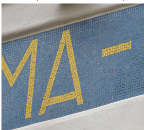
Cas particulier d'enseigne en mosaïque