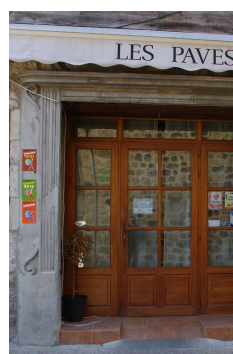
Enseigne sur store (Thuyets)