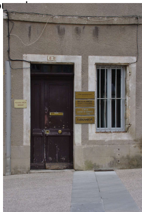
Exemple de positionnement non respectueux des modénatures A PROSCRIRE (Aubenas)

La signalétique réglementaire (professions réglementées, services publics...) doit être réduite au strict nécessaire. Le plus souvent cela se traduit par une plaque en laiton ou translucide apposée en façade. Son positionnement reste en lien avec la composition de la façade, notamment en respectant les encadrements et modénatures des