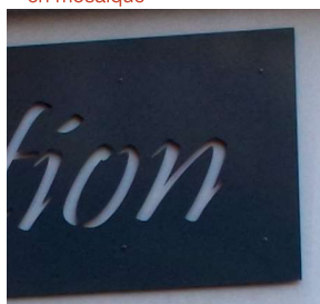
Exemples de métal découpé