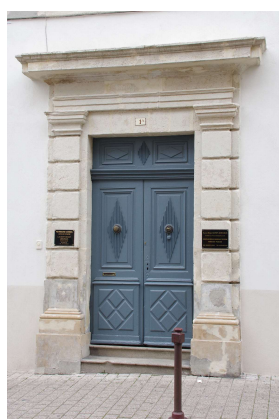
Exemple de positionnement respectueux des modénatures A PRIVILÉGIER (Aubenas)