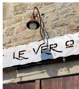
Éclairage indirect, en accord avec le style de l'enseigne (Chassiers)