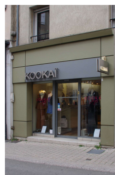
Devanture et enseigne (Aubenas)