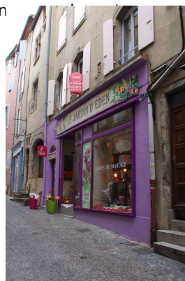
Devanture aux couleurs saturées A PROSCRIRE (Aubenas)

Pour les plaques professionnelles, elles doivent être positionnées en respectant l'encadrement de la porte (ne pas être positionné à la fois sur le mur de façade et l'encadrement). Si plusieurs plaques sont apposées pour le même bâtiment, il conviendra de trouver une harmonie de taille et de matériau. Elles seront positionnées de préférence, les un