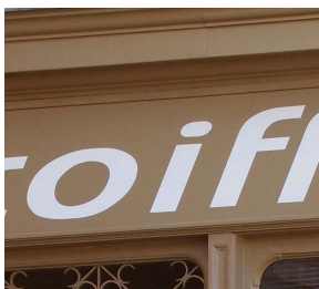
Exemples de lettres peintes

Les impressions PVC, stickers collés, impression sur panneau PVC, photo... sont à éviter.