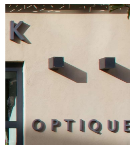
Éclairage indirect, spots accordés au graphisme et coloris de l'enseigne (Privas)