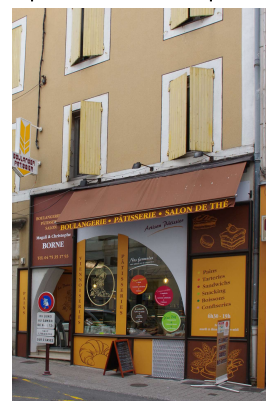
Devanture très chargée en information A PROSCRIRE (Aubenas)