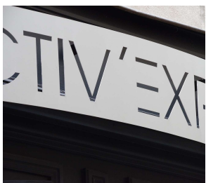
Exemple de métal découpé