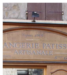
Éclairage indirect par spot (Jaujac)