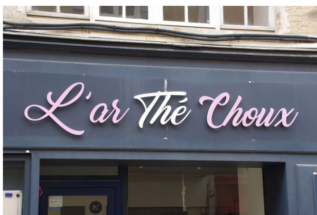
Devanture en applique (Tournon s/ Rhône)

Ain Allier Ardèche Cantal Drôme Isère Loire Haute-Loire Pays de Savoie Puy-de-Dôme Rhône et métropole de Lyon