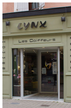
Enseigne lettres découpées (Aubenas)