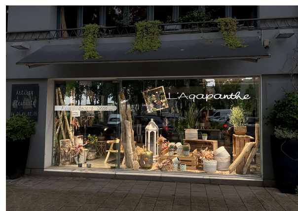
Éclairage de la vitrine depuis l'intérieur de la boutique (Tournon s/ Rhone)