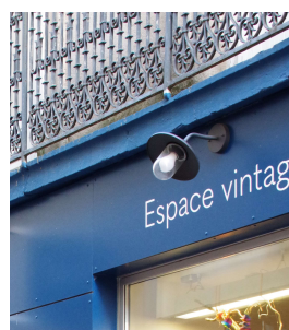
Éclairage indirect (Privas)

Privilégier des éclairages à base de LED, moins consommatrices en énergie. Le nombre de lumen/W est à étudier avec un professionnel ainsi que la température de couleur ou l'indice de rendu des couleurs afin de mettre en valeur les éléments éclairés.