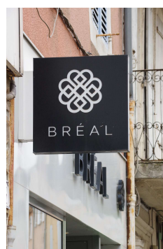
Enseigne drapeau (Aubenas)