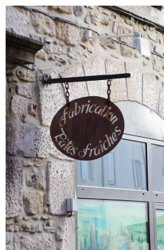
Enseigne drapeau (Privas)