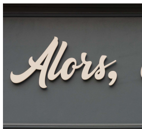
Exemples de lettres découpées