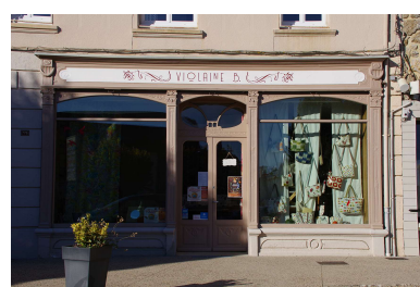
Devanture et enseigne (St Agrève)