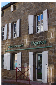
Enseigne sur lisse (St Agrève)