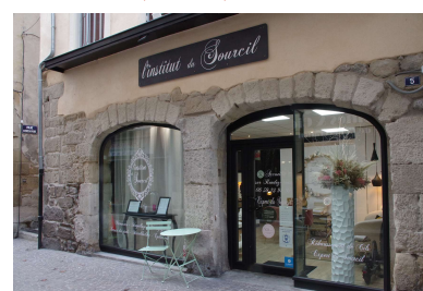
Devanture et enseigne (Tournon s/ Rhône)