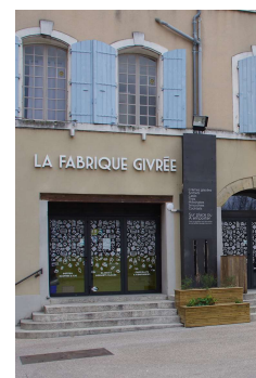
Devanture enseigne (Aubenas)