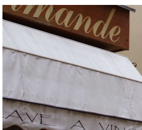
Exemple de lettres peintes Et support sur store