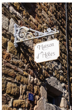
Enseigne drapeau (Naves)

Dans certain cas, c'est un store qui sert de support à l'enseigne.