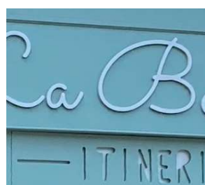
Exemple de lettres découpées et gravées