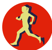
LA VERRIE'TABLE 7 km, 12 km