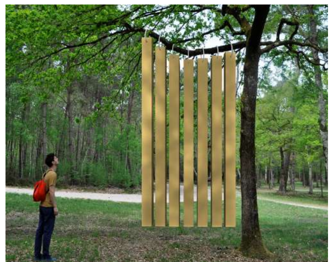
Camille Techer : the size of the container - 2019