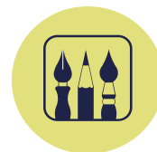
EXPO GRAND AIR