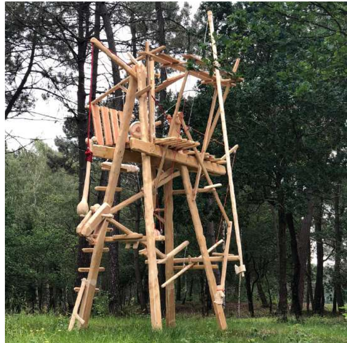
Mathieu Archambault de Beaune : Cheval, cheval, cheval, ni oui ni non - 2018