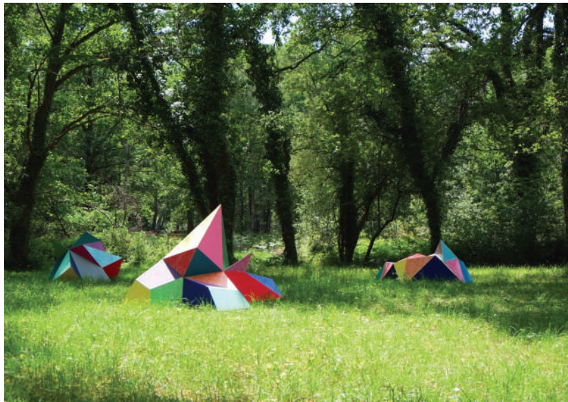
Elodie Boutry : Sous-bois - 2018