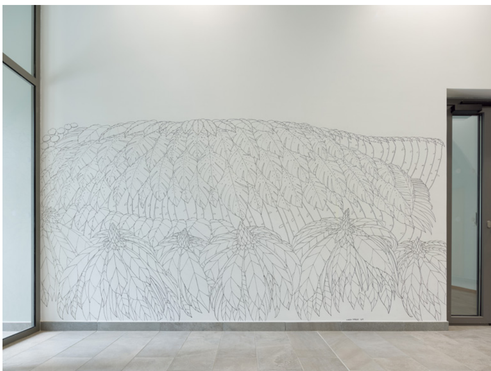
Cyprien Chabert, Le Bayou (Hall A), 2019