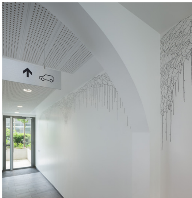
Cyprien Chabert, Le Bayou (Hall C), 2019