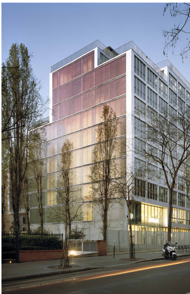
Carmen Perrin, Nuée d'Iris , 2020 © Photo : Axel Dahl © M.Vilo Bach et VINCI Immobilier

Conçu par le cabinet d'architecture M. Vilo Bach, l'immeuble Illumine a été entièrement restructuré pour accueillir des bureaux et un business center. Inscrit dans la démarche OpenWork de VINCI Immobilier qui met l'accent sur la performance du bâtiment et le bien-être de l'utilisateur, le bâtiment propose des terrasses, des balcons et une toiture dédiée à l'agriculture urbaine, qui constitueront autant de lieux de rencontre, de travail et de détente pour les futurs occupants. Le projet a été lauréat du concours des Pyramides d'Argent 2020.