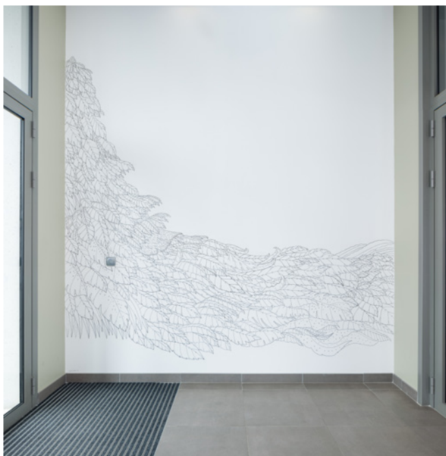
Cyprien Chabert, Le Bayou (Hall B), 2019