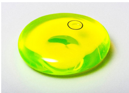
Mathieu Mercier, sans titre, 2021 Verre soufflé, eau, fluorescine, glycérine, sérigraphie 10 cm X 4 cm environ Production : Cirva

Le Cirva est une association à but non lucratif, reconnue d'intérêt général, qui est accompagnée depuis sa création par le ministère de la Culture, par la Ville de Marseille, par le conseil régional Sud Paca et par le conseil départemental des Bouches-du-Rhône.