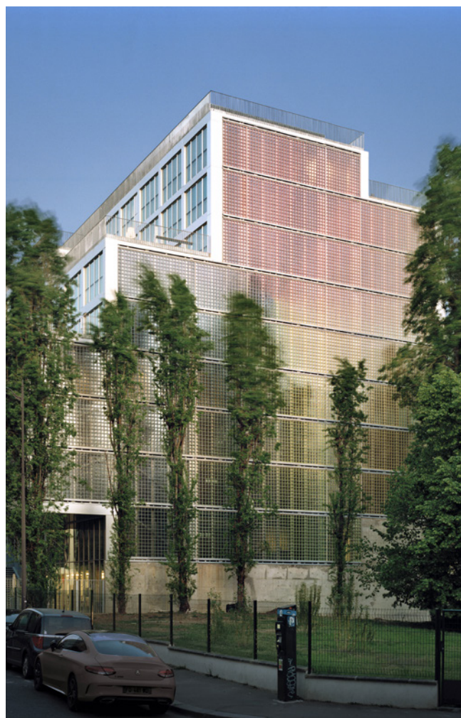
Carmen Perrin, Nuée d'Iris , 2020 © Photo : Axel Dahl © M.Vilo Bach et VINCI Immobilier