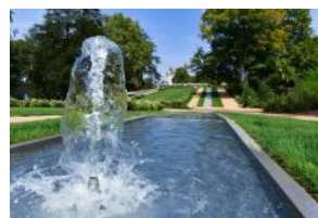
Jardins Lightroom