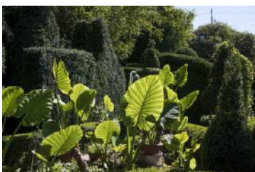
Linazay - Jardin de Fortran

La carte des jardins labellisés Jardin remarquable est en ligne sur le site Internet du ministère de la Culture