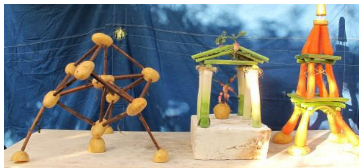
Édon - Jardin de la Mère Cucu