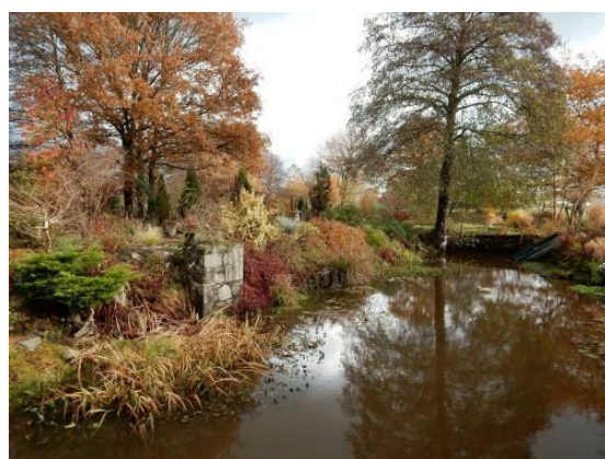
Y.A.K.FO.QU'ON au Jardin