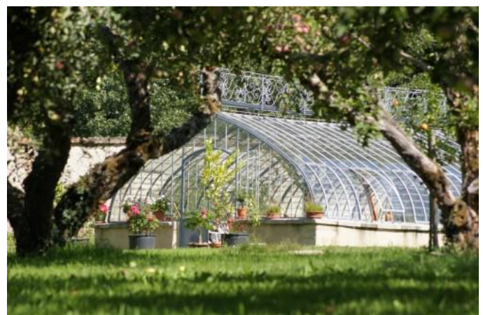
Serre du jardin du château de Salvanet