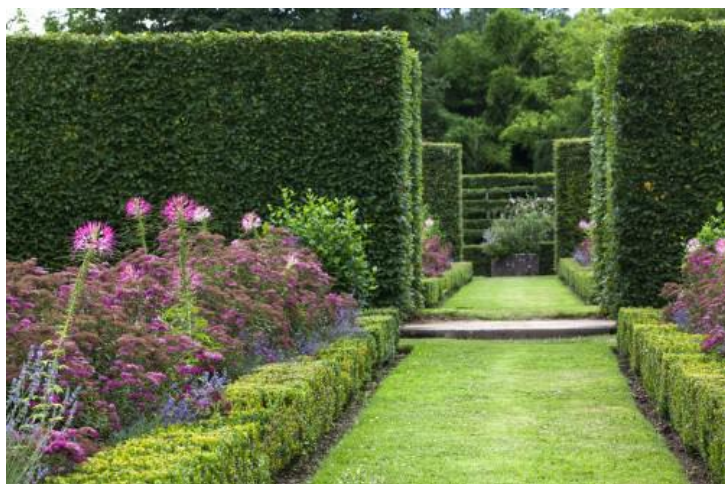
Jardins du château de Losse - Charmilles

À Périgueux , découverte des jardins ouvriers, familiaux ou collectifs avec une itinérance commentée des jardins ouvriers du quartier du Toulon aux jardins de Chamiers. Découverte des "Jardinots" de Chamiers avec le CAUE 24 et d'une expérimentation conduite par le Club de prévention Le Chemin autour de la promotion de la permaculture avec les jeunes des quartiers prioritaires de la politique de la Ville.