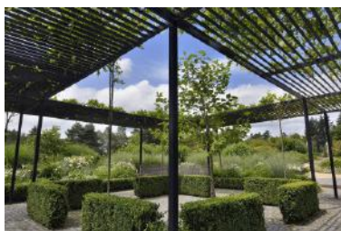
Les Jardins Sothys