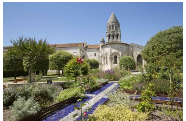
Saintes - Abbaye aux Dames - Jardin des Moniales