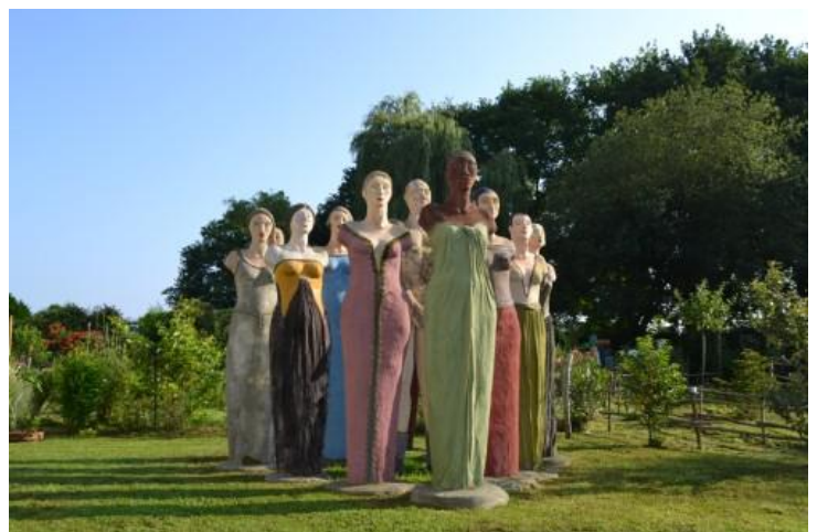
Le jardin des poètes et des anges - Cortège