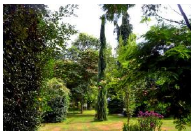
Arboretum Al Gaulhia