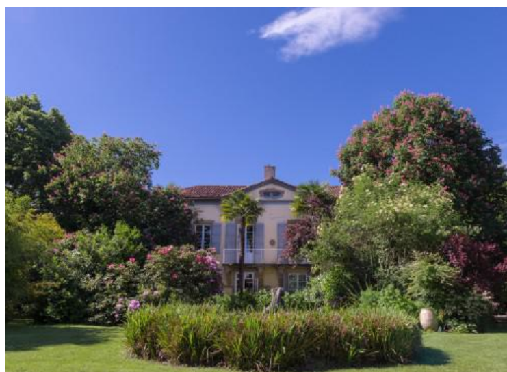
Jardin de Marrast