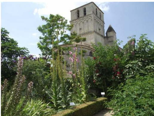
St-Sulpice de Royan

En Charente-Maritime , le visiteur passionné pourra se concocter un circuit en visitant plusieurs jardins proches les uns des autres au cœur même de certaines villes : 7 jardins à Jonzac , 2 à Matha , 4 à Rochefort , 5 à la Rochelle , 5 à Royan , 7 à Saintes .