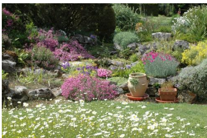
Jardirom à Sèvres-Anxaumont © Christian Rome

À Poitiers , le visiteur pourra découvrir 6 jardins totalement différents : un circuit dans le centre ville avec la découverte de différents jardins, le Jardin au bord du Clain , jardin privé permettant la découverte des bords de rivière en plein cœur de ville, le Parc de l'îlot Tison avec présentation du projet d'aménagement par la Ville de Poitiers. Le Service des Espaces Verts de la Ville de Poitiers se mobilise dans les trois grands parcs de la ville organisant des visites guidées par des guides-conférenciers : le Jardin des Plantes , le Parc de Blossac et le Parc Floral de la Roseraie .