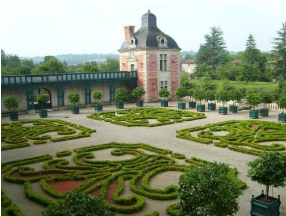
Jardins de l'Orangerie de la Mothe-Saint-Héray

Possibilité pour le public de visiter des jardins proches les uns des autres avec 2 jardins à Bressuire , 2 à Melle , 5 à Niort , et 3 à Vasles . À Niort, le Jardin des Plantes (découverte sensorielle et art-thérapie) et les Jardins de la Brèche proposent des animations avec des guides-conférenciers en partenariat avec France Alzheimer 79