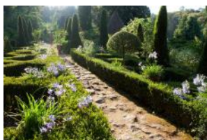
Jardins de cadiot