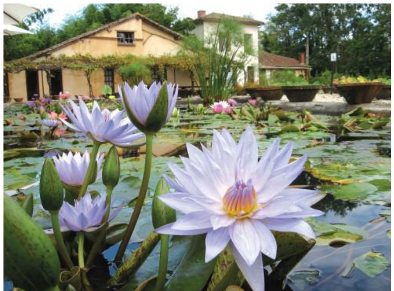
Le jardin des Nénuphars