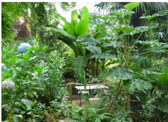
Jardin de Lalande

Spectacle de contes par la Compagnie "Graine de contes" au Jardin du métayer à Montfort-en-Chalosse avec des histoires pour petits et grands, faisant la part belle aux légumes du potager !