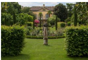
Jardin de Marrast