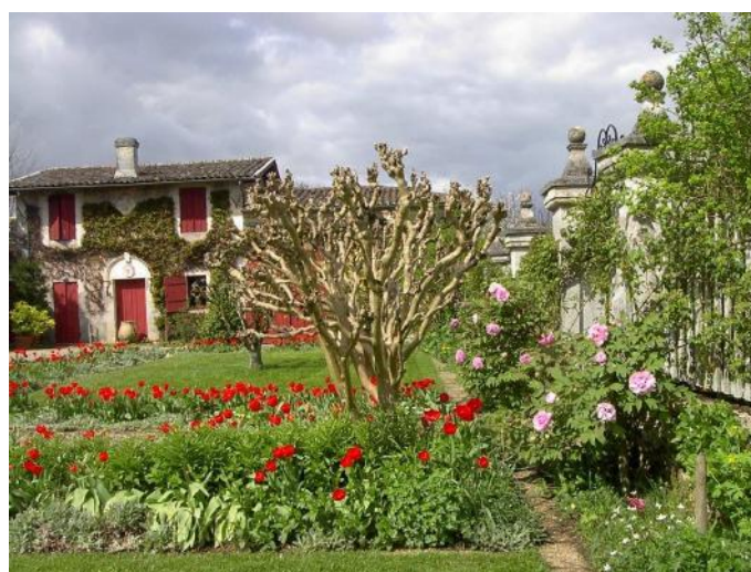
Portets - Jardin du château de Mongenan