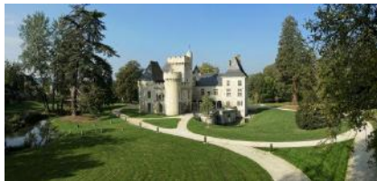
Domaine départemental de Campagne