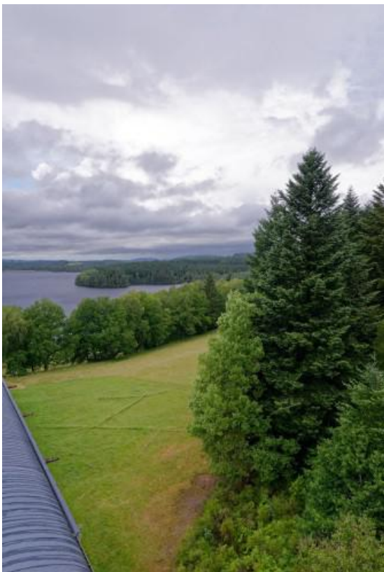
Beaumont-du-Lac © Centre International d'Art et du Paysage

À Limoges : une brocante au jardin aura lieu dans le jardin privé Des Tonnelles et des Roses et de nombreuses animations auront lieu dans le Jardin de l'Évêché , organisées par la Direction des Espaces Verts autour du thème 2018 consacré à l'Europe des jardins. À Nexon : le visiteur pourra découvrir le Jardin des Sens et le parc du château avec deux ambiances différentes.