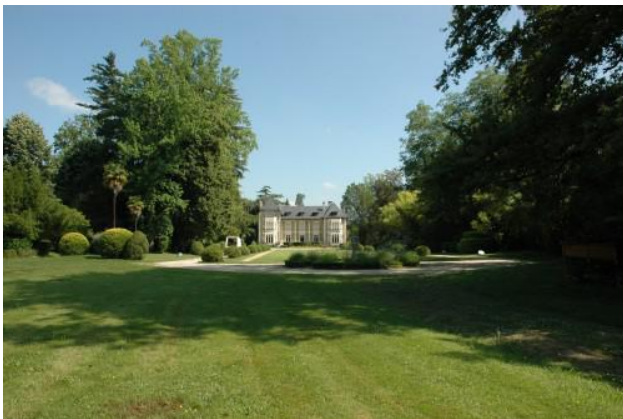
Jardin de la Villa Saint-Basil's

À Urrugne , dans le jardin du château d'Urtubie , exposition dans l'orangerie du XVIIIe siècle sur "Les Plantes du Pays Basque" qui soignent et qui parfument et leurs huiles essentielles avec vidéo et ateliers pédagogiques consacrés aux plantes médicinales.