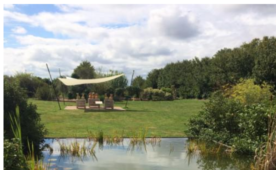
Chassenon - Jardins de Pline l'Ancien

Les visiteurs pourront découvrir 8 jardins en culture biologique, de 100 m 2 à 48 hectares, en parcourant le Circuit des jardins de Cognac et Châteaubernard .