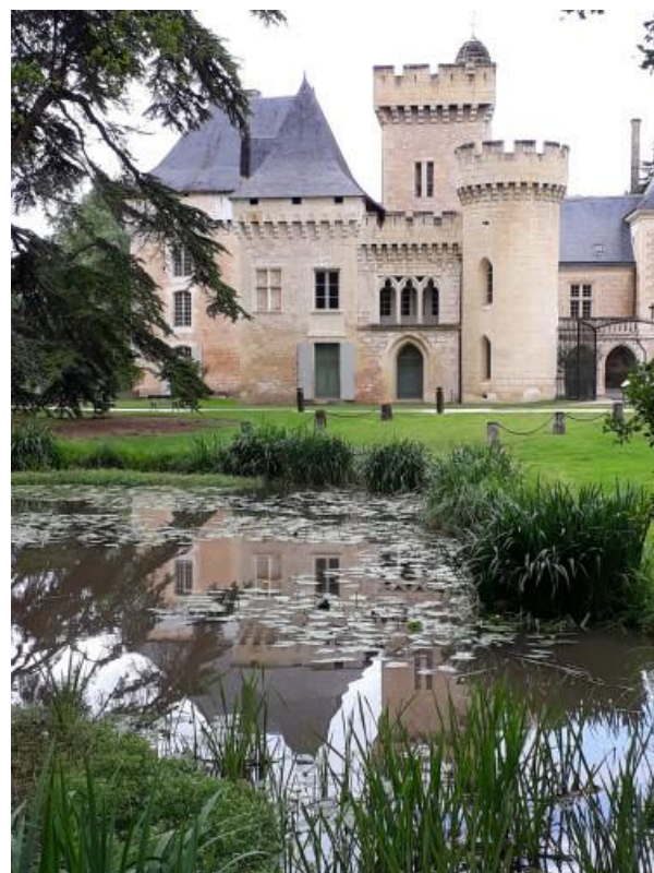
Parc départemental de Campagne