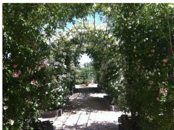
Égletons -Jardin médiéval