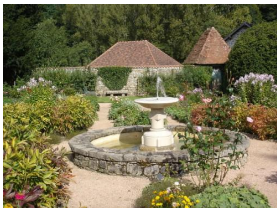
Domaine de Banizette

À Ahun , au Jardin du Paresseux , de nombreux conseils seront prodigués pour jardiner sans trop se fatiguer. Les méthodes proposées peuvent d'adapter à certains handicaps. Les droits d'entrée de ce jardin sont d'ailleurs intégralement reversés à l'enfance handicapée.