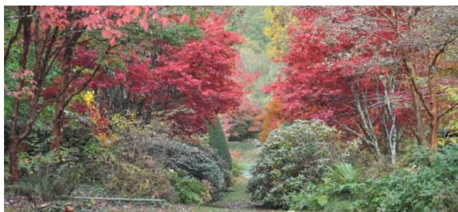
Arboretum de la Sédelle, couleurs d'automne