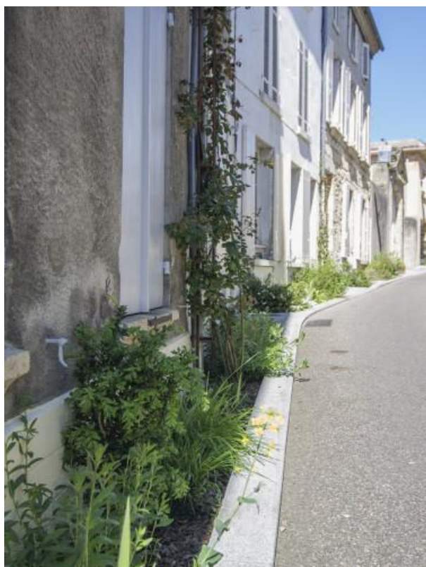
La Réole - La rue