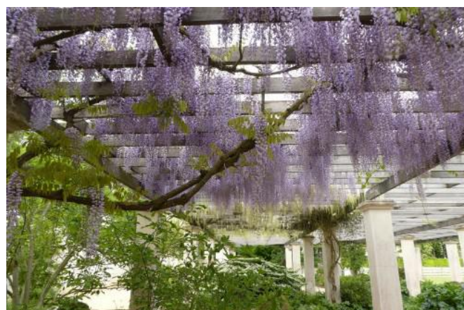
Parc de Blossac