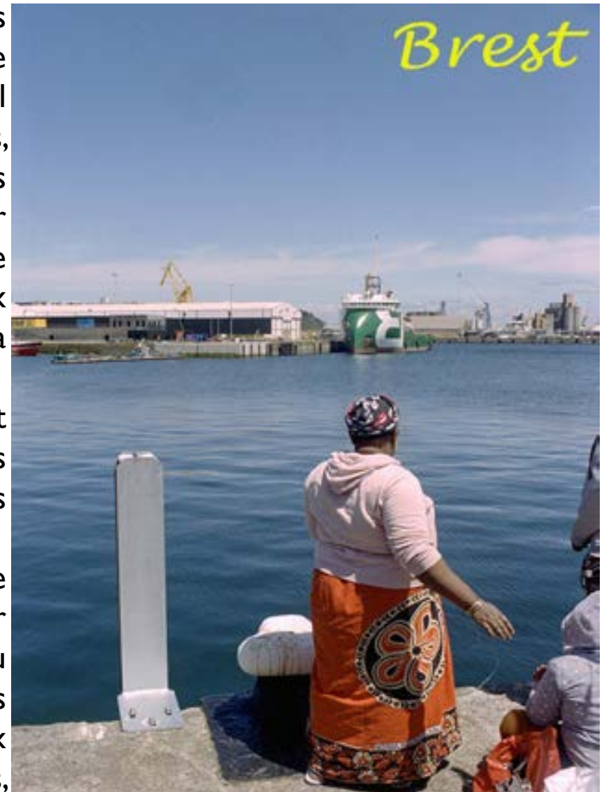
Pêche emblématique du maquereau au port de commerce de Brest en été

Cette initiative s'est engagée au printemps 2020 avec une première restitution publique du travail en atelier en janvier 2021, sous forme d'une production de cartes postales au moment du festival Pluie d'Images. Elle donne lieu à une suite plus conséquente tout au long de l'année 2021, avec de nouveaux ateliers et des restitutions prévues sous forme d'expositions, de nouvelles balades urbaines et d'une publication.