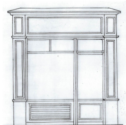
3 - Grille de ventilation encastrée dans l'allège de la devanture