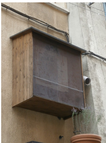
2 – Caisson admissible en cour arrière uniquement