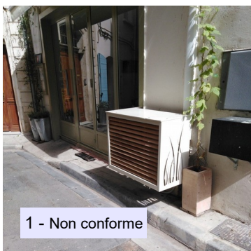
1 - Non conforme