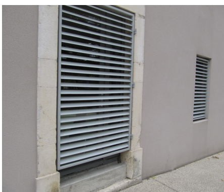
4 – grilles intégrées dans baie et dans mur enduit