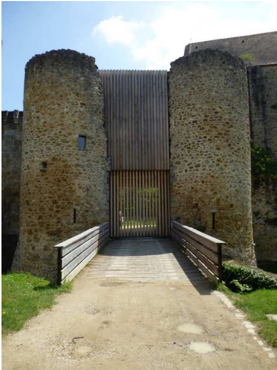
Château de Chevreuse - Aménagement de bureaux dans la poterne.

Pour devenir architecte et urbaniste de l'État (AUE), il faut passer un concours de la fonction publique d'État. La période d'inscription au concours se situe chaque année vers décembre et janvier. Les épreuves écrites se déroulent en février et les épreuves orales en mai.