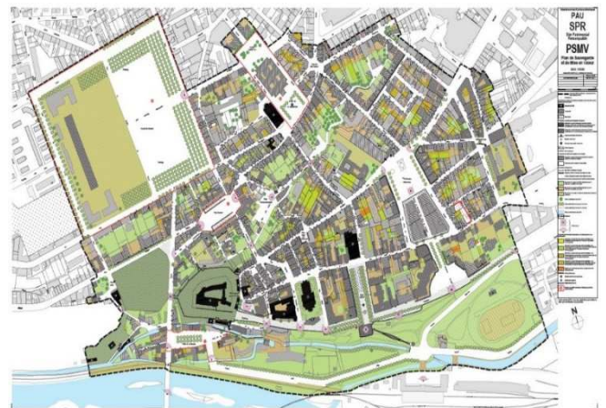
Pau, Plan de sauvegarde et de mise en valeur. Source Antoine Bruguerolle architecte-urbaniste

Après cette année de formation, et sous réserve d'avoir réussi les épreuves de fin de scolarité, les élèves sont titularisés architectes et urbanistes de l'État et sont affectés pour leur premier poste dans les ministères, en fonction de l'option qu'ils ont choisie au concours.