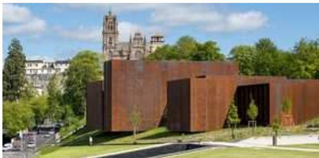
Rodez - Musée Soulages en site patrimonial remarquable.

En tant que cadre supérieur de la fonction publique d'État, l'architecte et urbaniste de l'État (AUE) occupe des fonctions de direction, conseil, encadrement, contrôle et expertise. Il peut également être chargé de missions d'enseignement, de recherche et de maîtrise d'œuvre. Le parcours de chaque AUE est spécifique. Chacun peut construire sa carrière en fonction de ses compétences, des besoins des services et des opportunités de postes qui se présentent. L'étendue des services de la Fonction publique permet d'offrir aux AUE un large choix de postes et de fonctions. Un suivi individualisé existe au sein du pôle ministériel de la transition écologique, de la cohésion des territoires et de la Mer pour accompagner et orienter les AUE dans leurs choix de carrière (changements de poste, avancement, etc.).