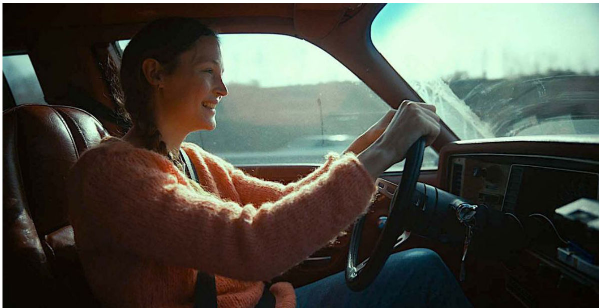
Photographie du film Serre moi fort