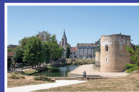
CAUE-IDF, Archipel francilien, 2020

Samedi et dimanche sur inscription 75018 Paris