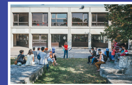
Université Paris 13 à Villetaneuse © Louise Allavoine

Samedi et dimanche sur inscription 92100 Boulogne-Billancourt