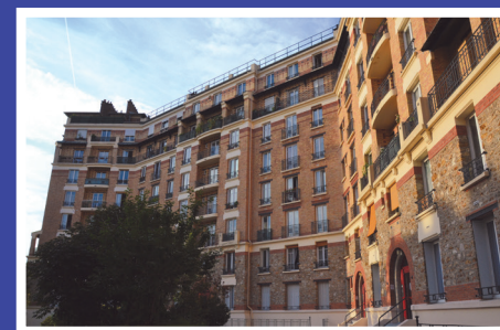
Paris, HBM, logements de 1913

La DRAC Île-de-France vous propose une sélection de balades architecturales près de chez vous.