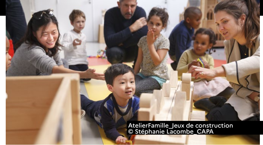
AtelierFamille Jeux de construction

8-10 square du Docteur Blanche 75016 Paris Visite libre > samedi 10h-18h Visite architecturale (sur inscription) > samedi 10h-10h30, 12h-12h30, 15h-15h30, 17h-17h30 Inscription : reservation@fondationlecorbusier.fr