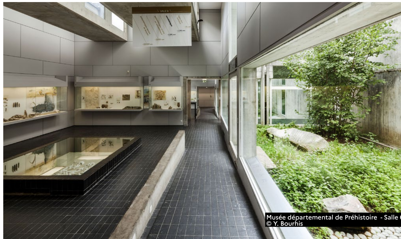
Musée départemental de Préhistoire - Salle 6.