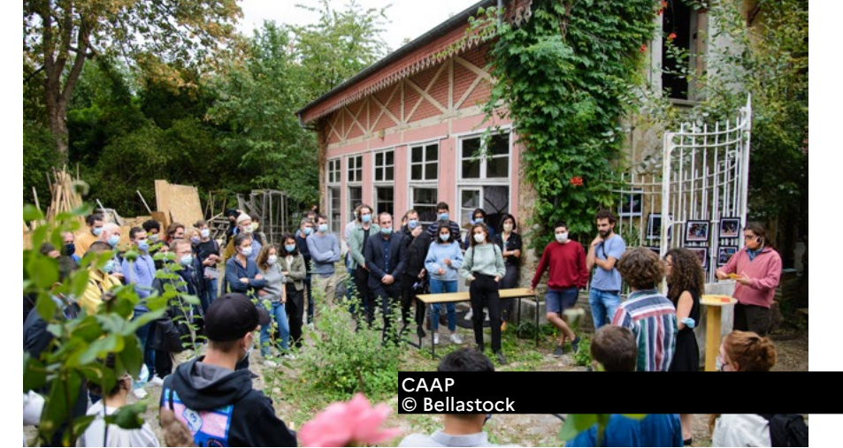
CAAP © Bellastock

PLACE D'ARME 78000 Versailles Itinéraire « Archipel francilien - Versailles-Chantiers - De la ville neuve au nouveau quartier » (sur inscription) > dimanche 11h-14h, 14h-15h, 15h-16h, 16h-19h Inscription : www.journeesarchitecture.fr