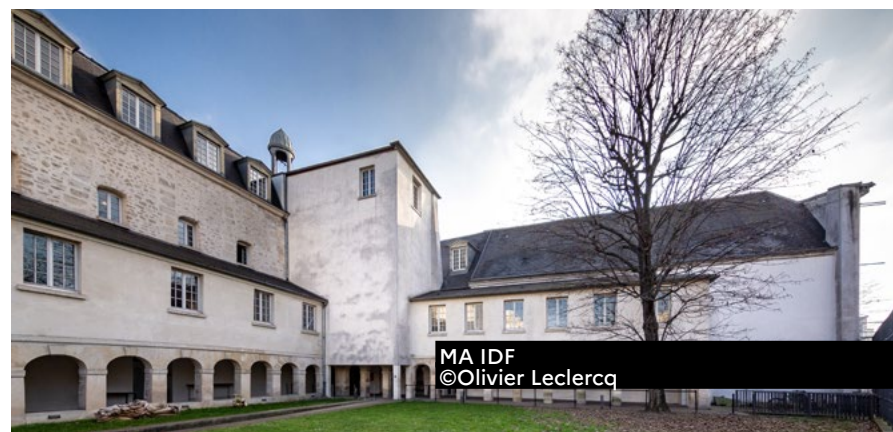
MA IDF

ATELIER SYLVIE CAHEN 19 rue Claude Tillier 75012 Paris 01 44 49 07 08, www.ateliersylviecahen.com Portes ouvertes (sur inscription) > vendredi 9h-11h30 Inscription : sc@ateliersylviecahen.com