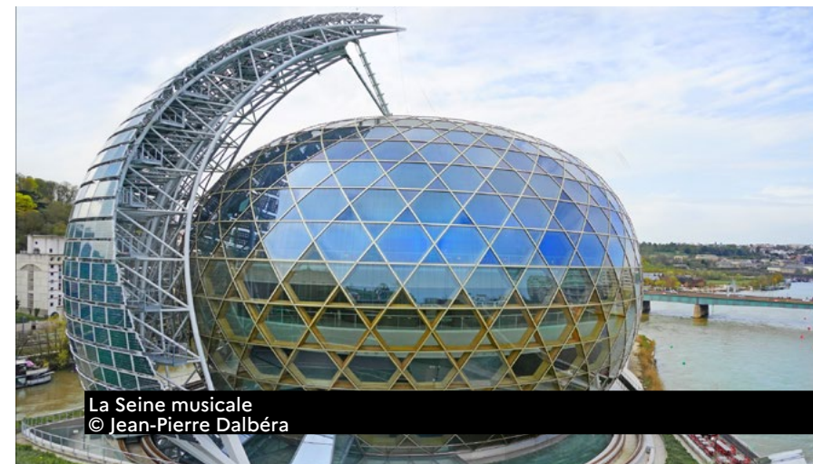
La Seine musicale

GROUPE SCOLAIRE SIMONE-VEIL 18 rue Mirabeau 94300 Vincennes 01 43 98 65 86 Visite architecturale (sur inscription) > samedi 14h-15h Inscription : 01 48 08 13 00