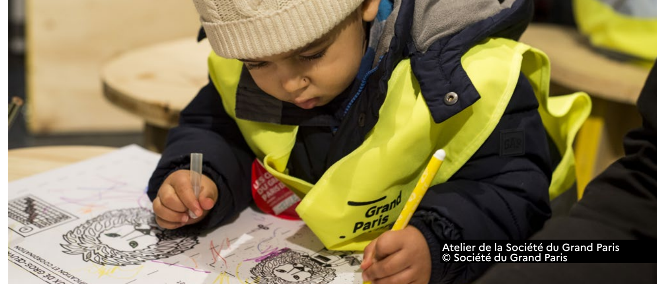
Atelier de la Société du Grand Paris © Société du Grand Paris

MÉMORIAL DU MONT-VALÉRIEN Avenue du professeur Léon-Bernard 92150 Suresnes 01 47 28 46 35, www.mont-valerien.fr Visite architecturale (sur inscription) > samedi 14h30-16h Inscription : reservation@mont-valerien.fr, 01 47 28 46 35