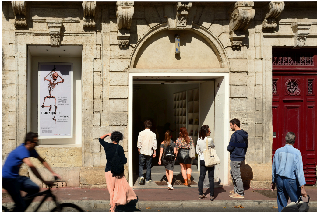
FRAC Languedoc-Roussillon, 2016.

La programmation du week-end des FRAC est organisée par les 23 FRAC et coordonnée par PLATFORM, Regroupement des Fonds régionaux d'art contemporain, avec le soutien du ministère de la Culture et de la Communication et de l'ADAGP.