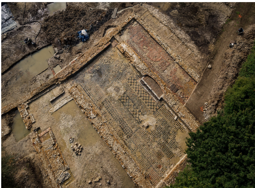
Saint-Martin-d'Hardinghem (Pas-de-Calais) photo aérienne des pavements