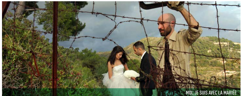
MOI, JE SUIS AVEC LA MARIÉE

REMISE DES PRIX DE LA COMPÉTITION DE COURTS MÉTRAGES