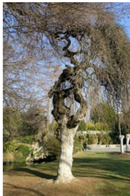
© Drac paca crmh, Jean Marx, 2005

Au sud de la ville, tout près de la mer, le plus vaste parc marseillais accompagne un château construit de 1768 à 1778 par les architectes Brun, Peyre et Clérisseau pour un riche commerçant, Louis Borély. Réalisé aux 18 e et 19 e siècles, le parc voit l'intervention de six paysagistes successifs: Embry (jardin classique en 1770), Paré (parc à l'anglaise en 1859), Alphand et Barillet-Deschamps (principaux auteurs du parc actuel en 1862), les frères Bülher (premier jardin botanique en 1880). Deux grandes parties sont juxtaposées: à l'ouest le jardin à la française, grande perspective axée sur le château, à l'est le parc à l'anglaise dont les allées sinuent autour d'un lac. De ce parc on accède au jardin botanique dont la serre présente la flore tropicale.