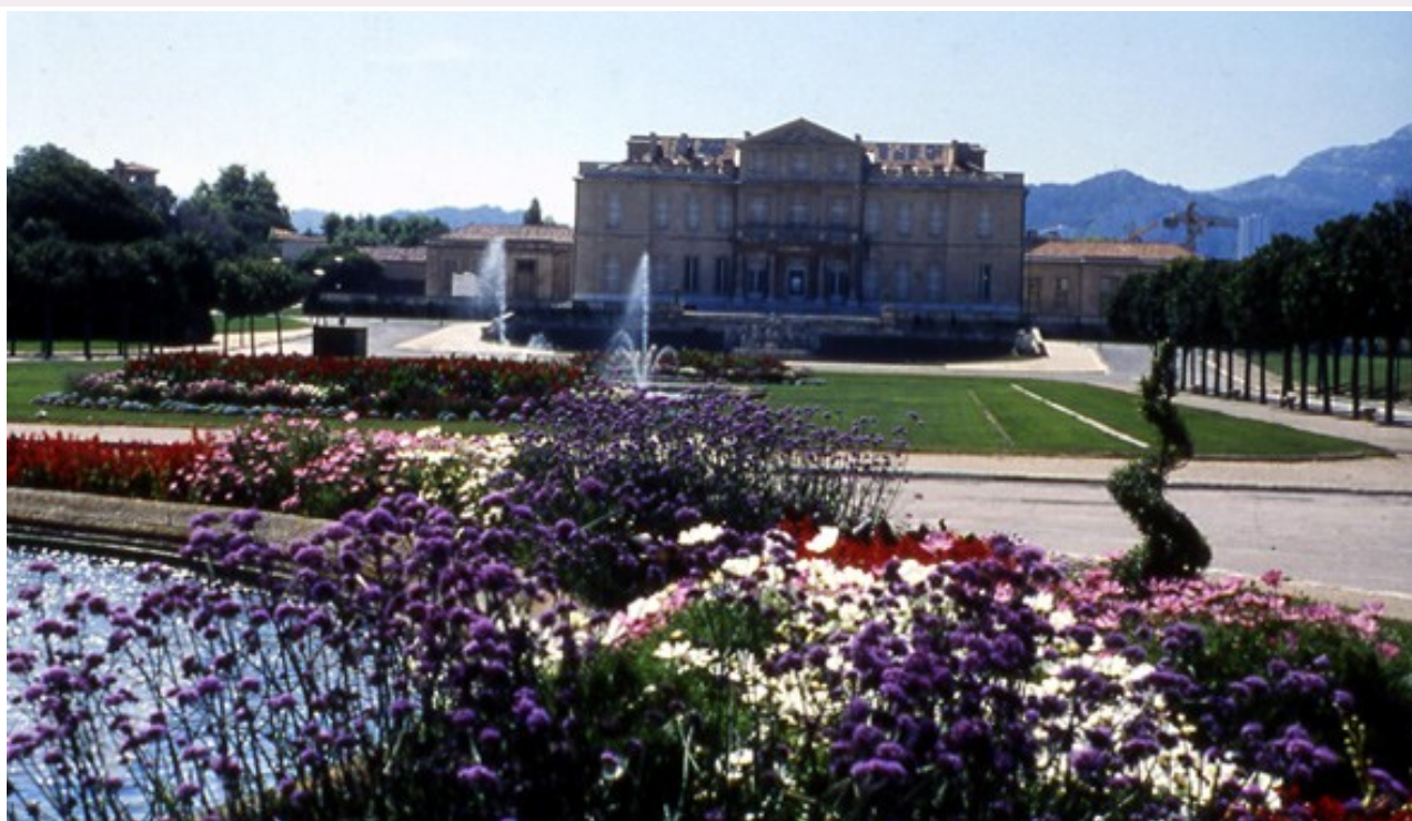
© Ville de Marseille, direction des parcs et jardins

Au sud de la ville, tout près de la mer, le plus vaste parc marseillais accompagne un château construit de 1768 à 1778 par les architectes Brun, Peyre et Clérisseau pour un riche commerçant, Louis Borély. Réalisé aux 18 e et 19 e siècles, le parc voit l'intervention de six paysagistes successifs: Embry (jardin classique en 1770), Paré (parc à l'anglaise en 1859), Alphand et Barillet-Deschamps (principaux auteurs du parc actuel en 1862), les frères Bülher (premier jardin botanique en 1880). Deux grandes parties sont juxtaposées: à l'ouest le jardin à la française, grande perspective axée sur le château, à l'est le parc à l'anglaise dont les allées sinuent autour d'un lac. De ce parc on accède au jardin botanique dont la serre présente la flore tropicale.