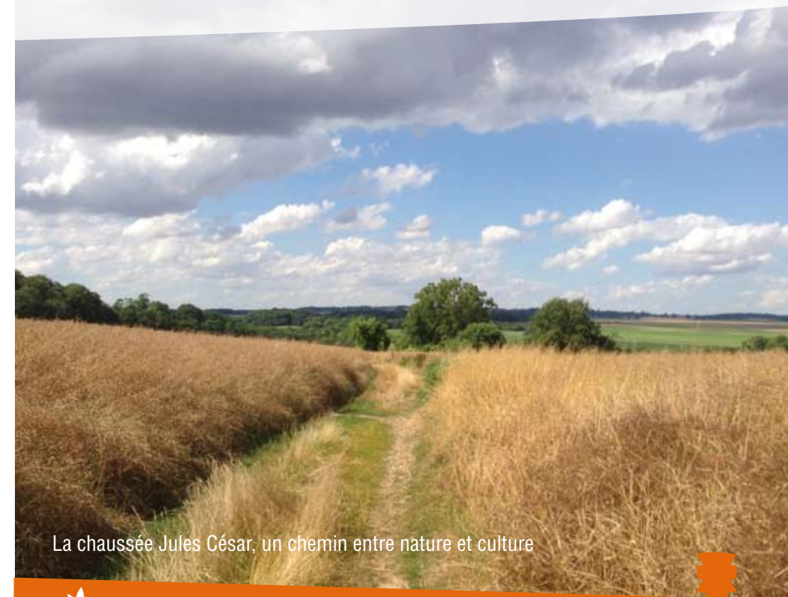
La chaussée Jules César, un chemin entre nature et culture