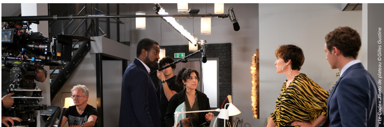
«Le Code».

Les projets seront suivis jusqu'à aboutissement par la Caisse des dépôts et le CNC.