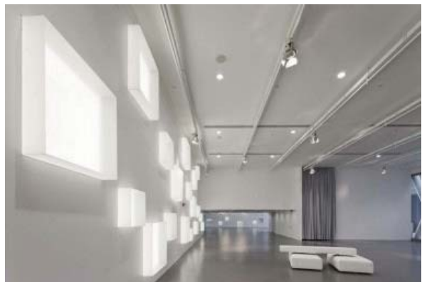
Un exemple d'ambition affichée : le Centre de design de Hong-Kong