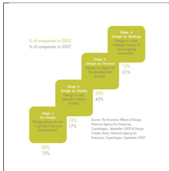
Danish Design Ladder

L'objectif premier de la PND à cet égard est de « faire sauter le pas » à des entrepreneurs qui n'auraient jamais intégré le design dans leur offre de produits et services et, en quelque sorte, de sécuriser ce premier recours (passage du niveau 1 au niveau 3 – ci-dessous –).