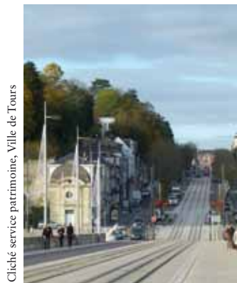
La percée du coteau de la Tranchée