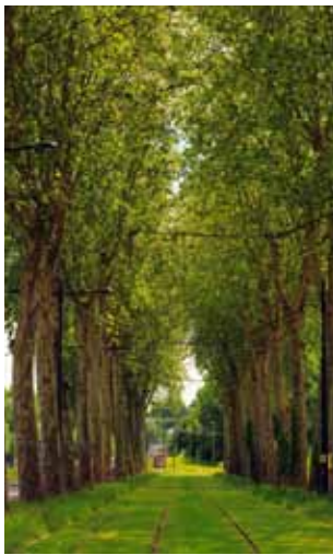
L'avenue de Pont-Cher