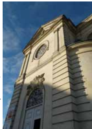
Église du Christ-Roi