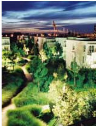
Le quartier des Deux-Lions

Au gré d'une promenade pédestre, le quartier réserve bien des surprises : la coulée verte, l'ancienne ferme des Granges Collières, l'Heure Tranquille et sa galerie marchande couverte en matière gonflable (éthylène Tétr fluoréthylène, un polymère fluoré thermoplastique posé sur des arceaux, et équipé d'une ventilation).