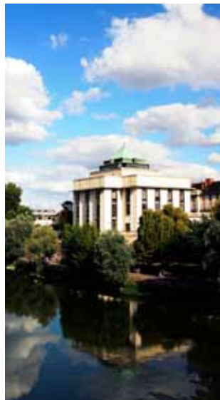
Le paysage urbain vu depuis la promenade Wilson