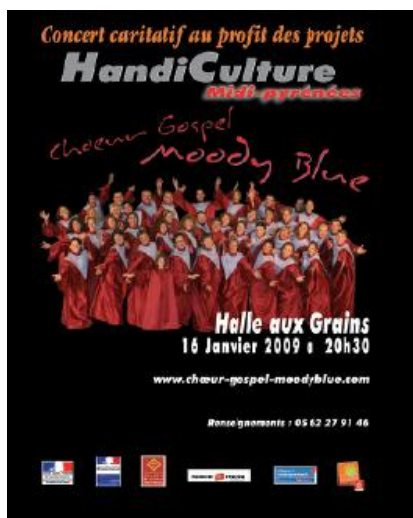
Affiche concert 2009