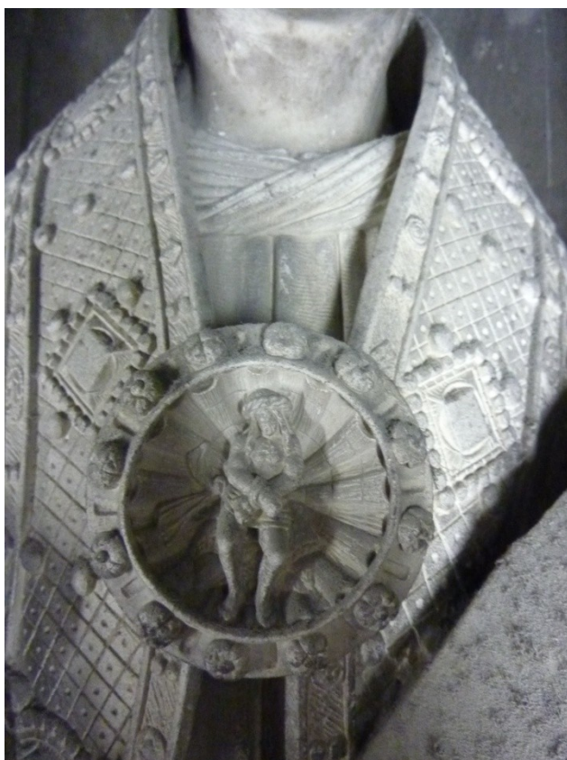
Photos 1 et 3 : Essais de nettoyage de la sculpture. Photo 2 : Ecce homo, détail du fermail d'un ecclésiastique.

L'association des Amis de la cathédrale se lance dans ce magnifique projet aux côtés de l'Etat et s'apprête à financer une première tranche de travaux.