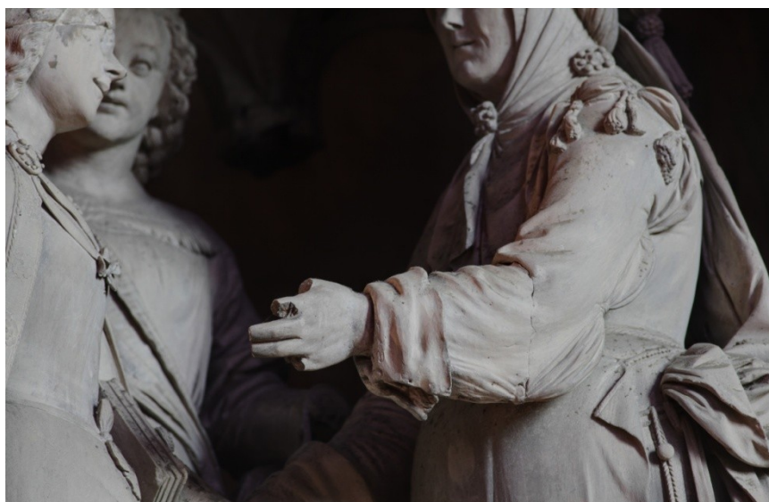
Exemples des altérations affectant le Tour du chœur : empoussièrément, fissures, cassures et manques.