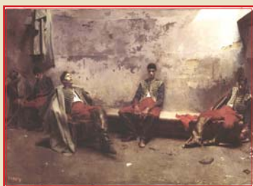
Les prisonniers de guerre, Lalaing, Jacques Comte © H. Maertens

> 16h30 : Fin du parcours devant le monument « Au Pigeon voyageur », entrée du bois de Boulogne, citadelle de Lille.