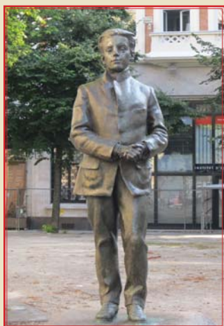
Statue de Léon Trulin, Edgar Boutry © Service Ville d'art et d'histoire, ville de Lille