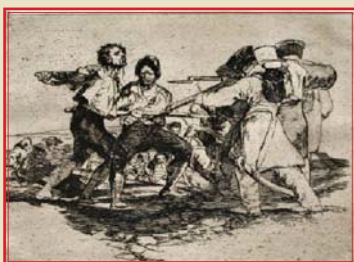
Goya, Con razon o sin ella , pl. 2 des Désastres de la Guerre , 1810 - 1815, eau-forte et aquatinte