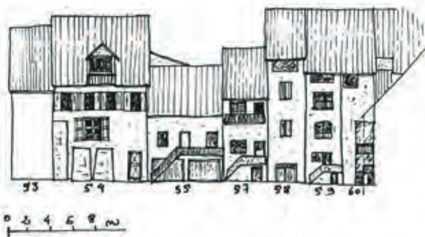
Facades Place Général Dossé

Batiments simples en profondeur - 3 niveaux rue C. Hugues - 3 niveaux pl. g. Dossé. Toiture à 2 versants faitage d'écote -