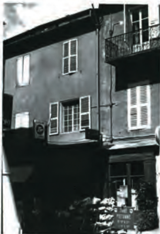
Facade rue Clovis Hugues

Situation : la parcelle 57 se compose de deux immeubles qui se succèdent l'un à l'autre et qui sont mitoyens de chaque côté par pignons