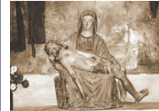
Vallouise, église Saint-Étienne, Pèta, bois polychrome, début du XVI e siècle (CLMH 1988)