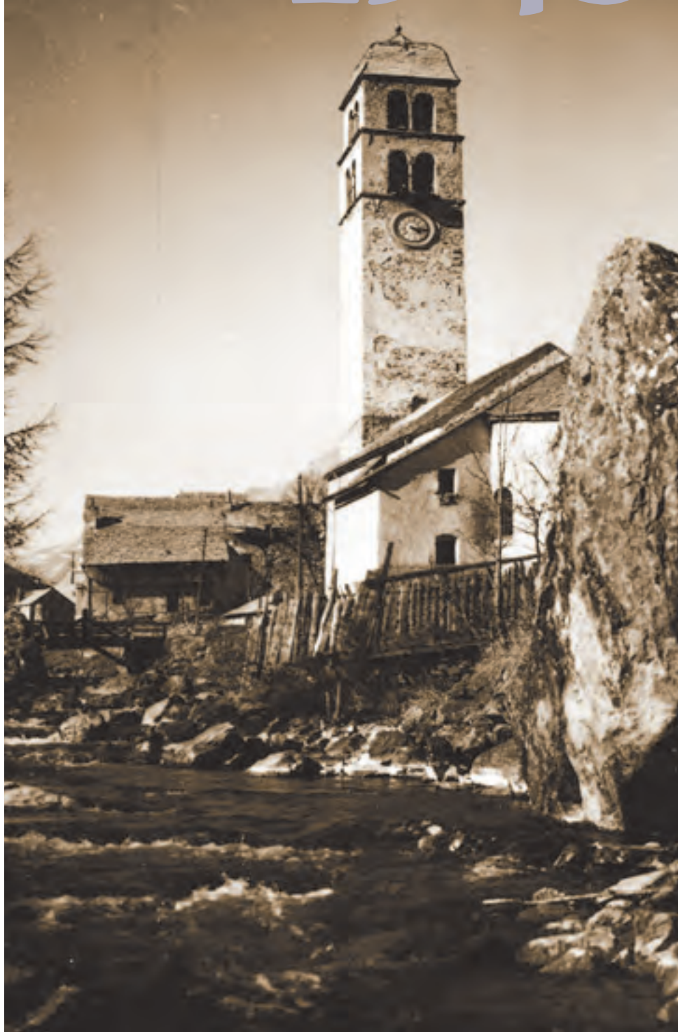
Le Monétier-les-Bains, hameau du Casset, église Saint-Claude (ISMH 1945)

1943 loi du 23 février 1943 instituant un périmètre de protection de 500 mètres autour des monuments historiques 1945 création de l'Organisation des Nations Unies pour l'éducation, la science et la culture (UNESCO)