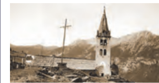
Puy-Saint-Pierre, église Saint-Pierre (ISMH 1989)