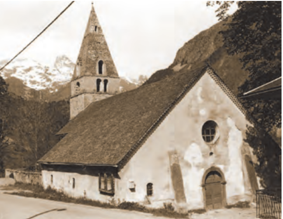
Saint-Maurice-en-Valgaudemar, église Saint-Maurice (ISMH 1939 et 1949, SC 1946)

1946 création des Agences des bâtiments de France, devenues Services départementaux de l'architecture (SDA) en 1979, puis Services territoriaux de l'architecture et du patrimoine (STAP) en 2010 1959 création du ministère des Affaires culturelles