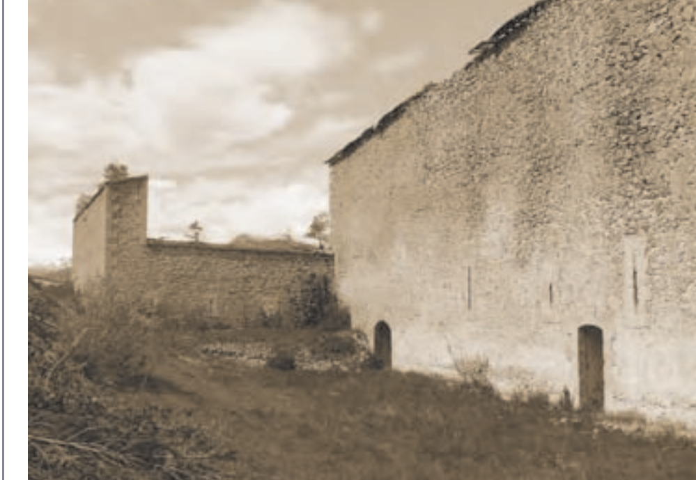
Briançon, fort Dauphin (CLMH 2007) © STAP des Hautes-Alpes, cl. Ph. Grandoinnet 2013 Briançon, fort Dauphin (CLMH 2007) © STAP des Hautes-Alpes, cl. Ph. Grandoinnet 2013

2010 loi du 12 juillet 2010 portant engagement national pour l'environnement, dite Grenelle II : transformation des ZPPAUP en Aires de mise en valeur de l'architecture et du patrimoine (AVAP)