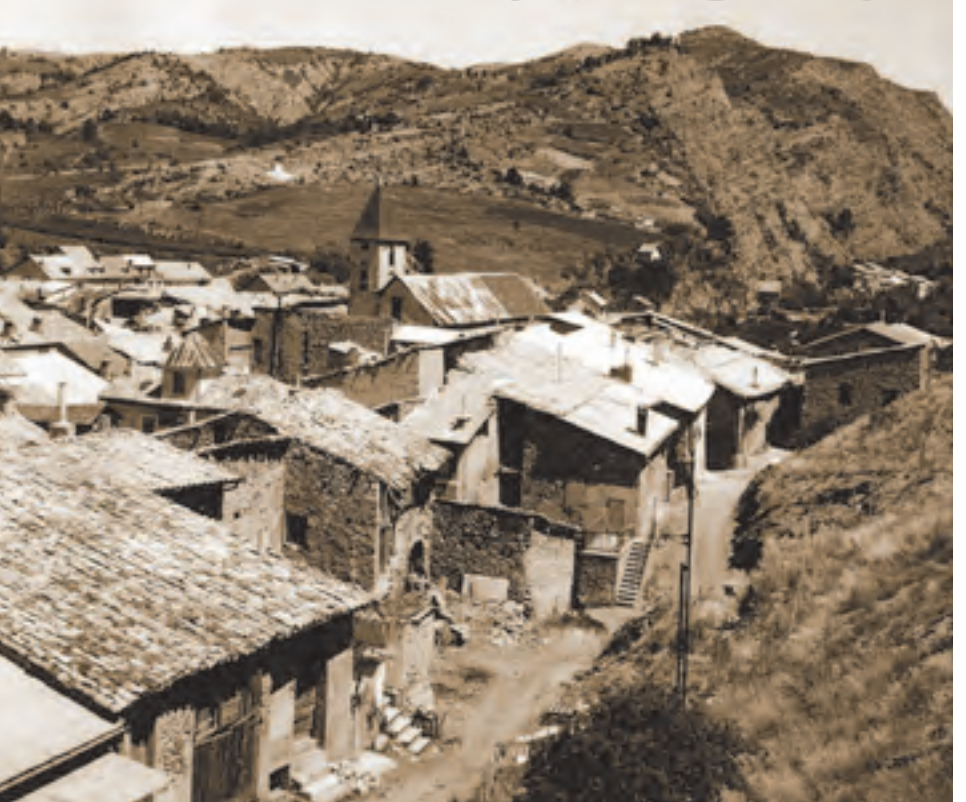
Tallard, vieux village (SI 1966)

1946 création des Agences des bâtiments de France, devenues Services départementaux de l'architecture (SDA) en 1979, puis Services territoriaux de l'architecture et du patrimoine (STAP) en 2010 1959 création du ministère des Affaires culturelles