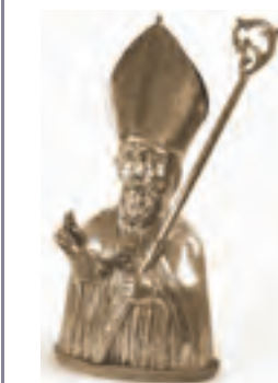
Gapègnais, font de saint Grégoire (CLMH 1997), XVII e siècle