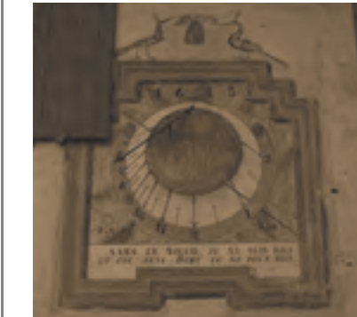
Val-des-Près, cadran solaire à Pra-Premier (ISMH 1995)