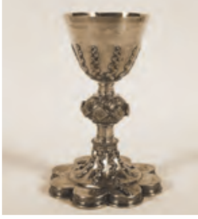
Briançonnais, calice, XVII e siècle (CLMH 1904)