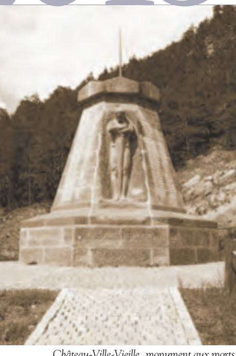
Chateau-Ville-Vieille, monument aux morts, dit de l'Ange Gardien (ISMH 2010)