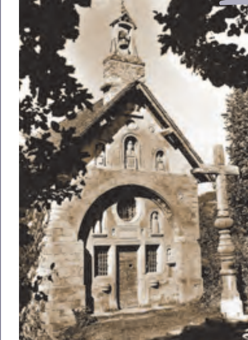
Saint-Bonnet-en-Champsaur, chapelle Saint-Grégoire dite « des Pêtières » (CLMH 1994)