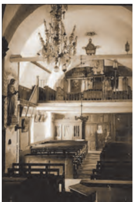
Le Monétier-les-Bains, hameau des Guibertes, église du Saint-Esprit (ISMH 1988), vue intérieure de la nef

1987 charte internationale pour la sauvegarde des villes historiques (Charte de Washington)