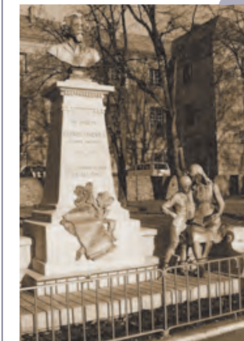
Embrun, monument à Clovis Hugues (ISMH 2009)