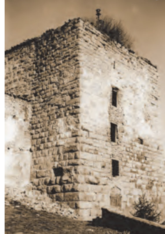
Rosans, tour sarrazine (ISMH 1932)