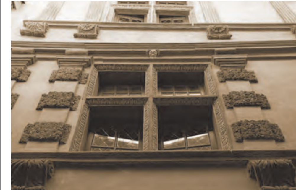
Serres, maison dite « de Lesdiguières » (CLMH 2000)

1999 charte internationale du patrimoine bâti vernaculaire (ICOMOS)