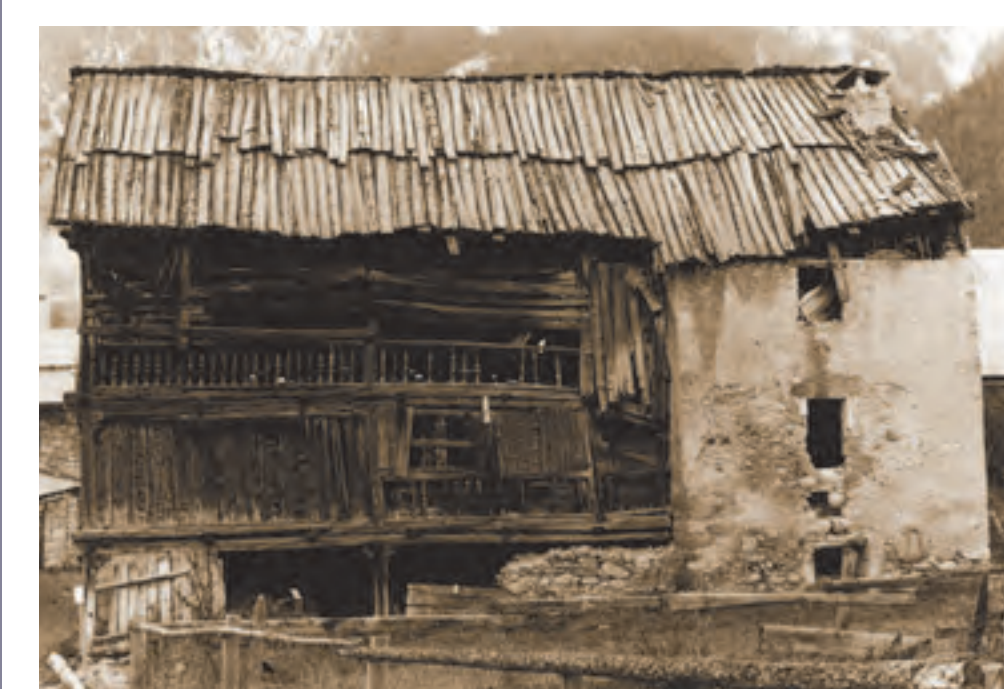
Celliers, maison Chabrand (CLMH 1991)

1993 loi du 8 janvier 1993 relative à la protection et la mise en valeur des paysages