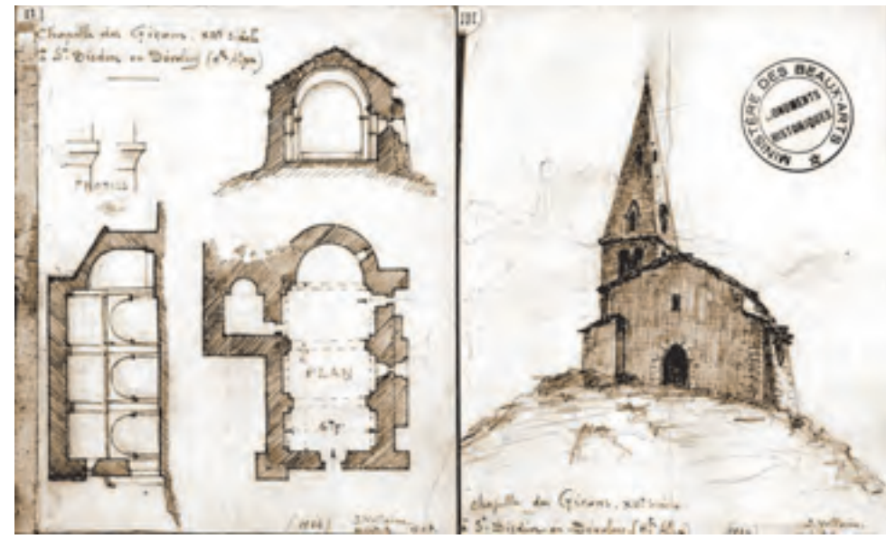
Le Devoluy, chapelle des Gicons, dite « Mère-église » (CLMH 1927) (dessin de J. Voltaire, 1924)