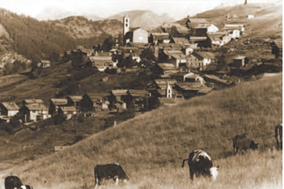
Saint-Véran depuis la route de Clausis (SI 1945)

1943 loi du 23 février 1943 instituant un périmètre de protection de 500 mètres autour des monuments historiques 1945 création de l'Organisation des Nations Unies pour l'éducation, la science et la culture (UNESCO)