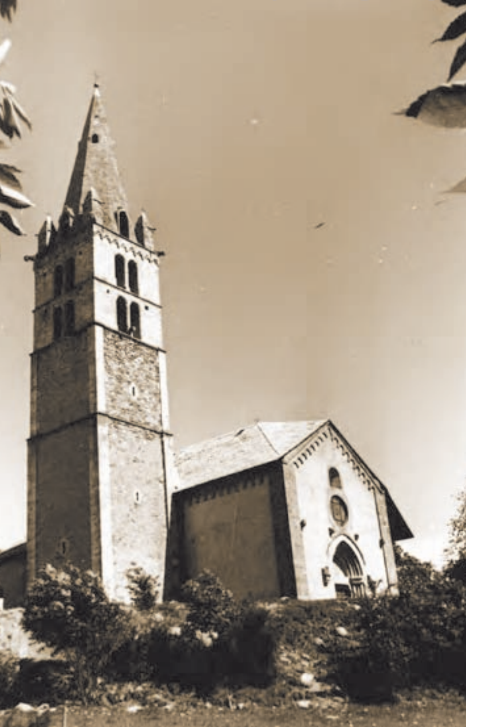
Saint-Sauveur, église de la Transfiguration (CLMH 1984)

1962 loi du 4 août 1962 instituant les secteurs sauvegardés 1964 charte internationale sur la conservation et la restauration des monuments et des sites (dite Charte de Venise) 1965 création du Conseil international des monuments et des sites (ICOMOS) 1977 loi du 3 janvier 1977 sur l'architecture