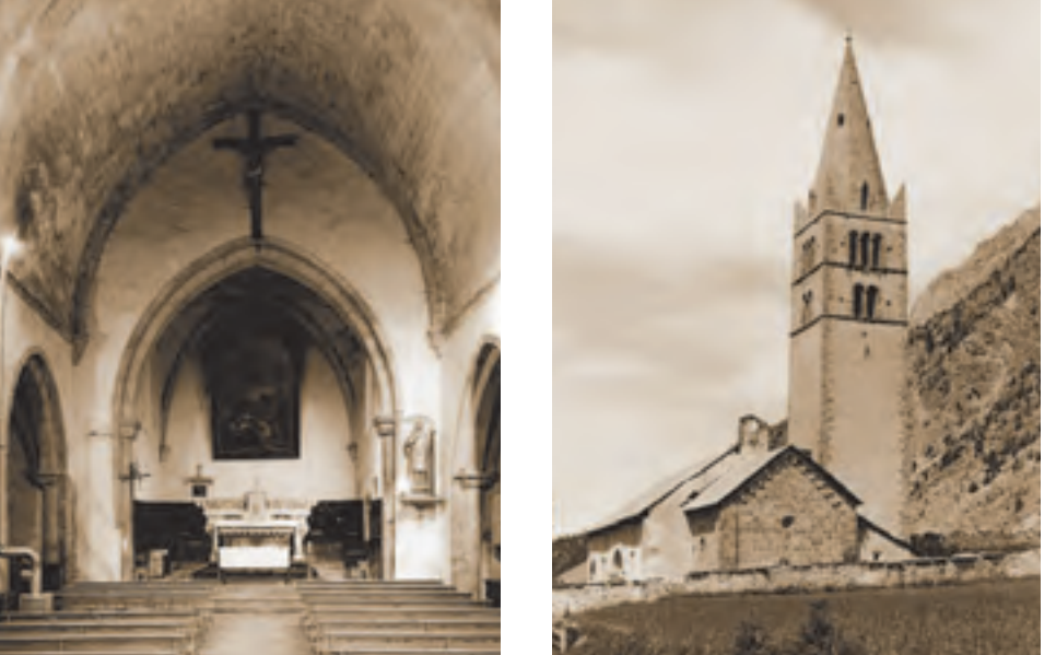
Crots, église Saint-Laurent (ISMH 1978), vue intérieure de la nef