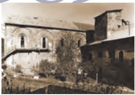
Crots, abbaye de Boscodon (CLMH 1988) © STAP des Hautes-Alpes 1972