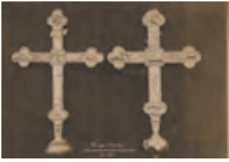
Chorges, église Saint-Victor, crois processionales