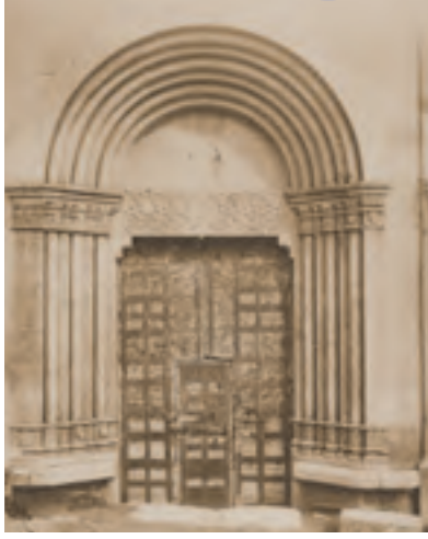
L'Argentière-la-Bessée, portail de l'église Saint-Apollinaire (CLMH 1913) © DRAC PACA, cl. Mennelle 1887