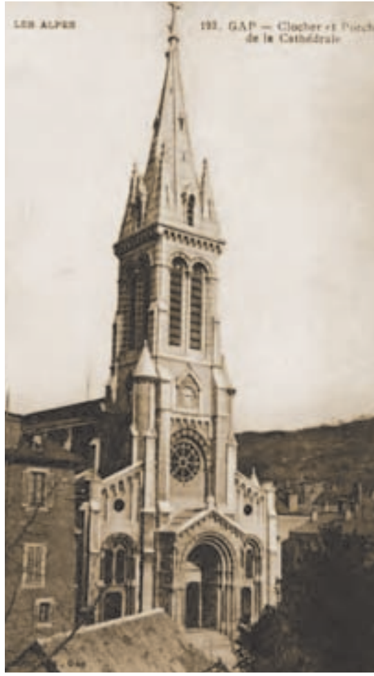
Gap, cathédrale Saint-Arnoux (CLMH 1906)