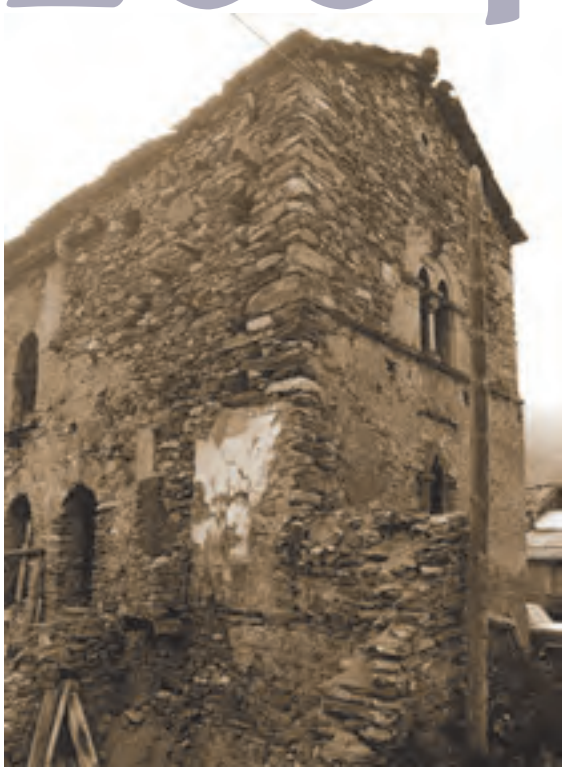
Molines-en-Queyras, maison à fenêtre géminée à la Rua (CLMH 1995)