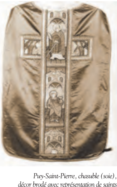
Pray-Saint-Pierre, chasuble (soie), décor brodé avec représentation de saints (fil de soie, or et argent), XVI e siècle