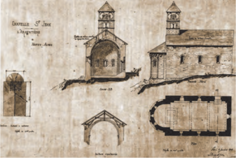
L'Argentières-la-Bessée, chapelle Saint-Jean, relevé de 1908