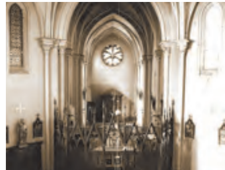
Gap, chapelle du Saint-Coeur (ISMH 1990), vue intérieure du chœur