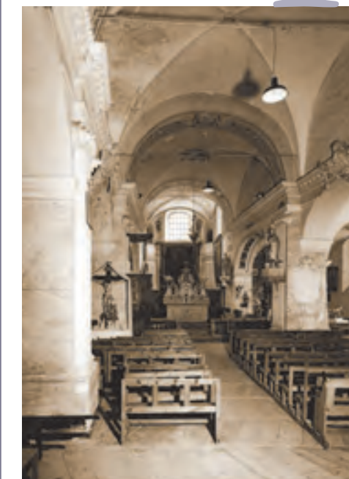
Val-des-Près, Le Serre, église Saint-Claude (ISMH 1989), vue intérieure de la nef