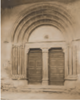
Chorges, église Saint-Victor, portail sur la façade latérale nord