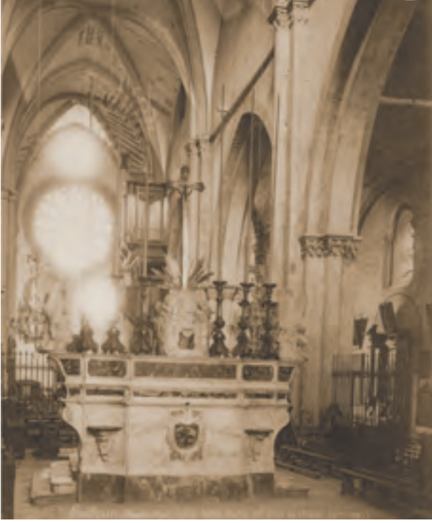
Embrun, ancienne cathédrale Notre-Dame du Réal, vue de la nef depuis le chœur