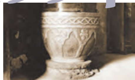
Les Vigneaux, font baptêmeaux, XVI e siècle (CLMH 1990)