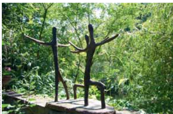
Installation de Patrick Condouret

Sur sites privés, aux franges de la bastide, anciens jardins potagers ou vergers d'implantation médiévale, soit enclos de murs et reliés par un maillage de ruelles, soit mitoyens et préfigurant les récents jardins familiaux.