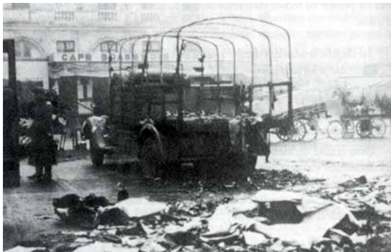
Opération contre les troupes d'occupation, place du Capitole en 1944

(à convenir par mail elerika@wanadoo.fr )