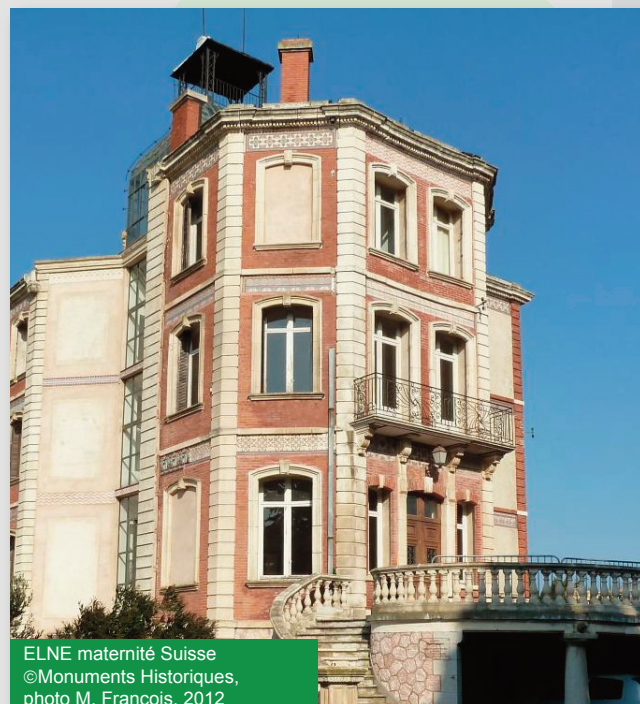
ELNE maternité Suisse ©Monuments Historiques, photo M. François, 2012

Jusqu'au 30 septembre 2013, la Maternité Suisse accueille l'exposition "Femmes oubliées, l'histoire du Secours Suisse aux enfants 1917-1948" qui rend hommage à d'autres volontaires qui, comme Elisabeth Eidenbenz, se sont engagés au péril de leur vie pour secourir les