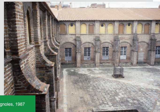
COUVENT DES MINIMES PERPIGNAN_CouventMinimes