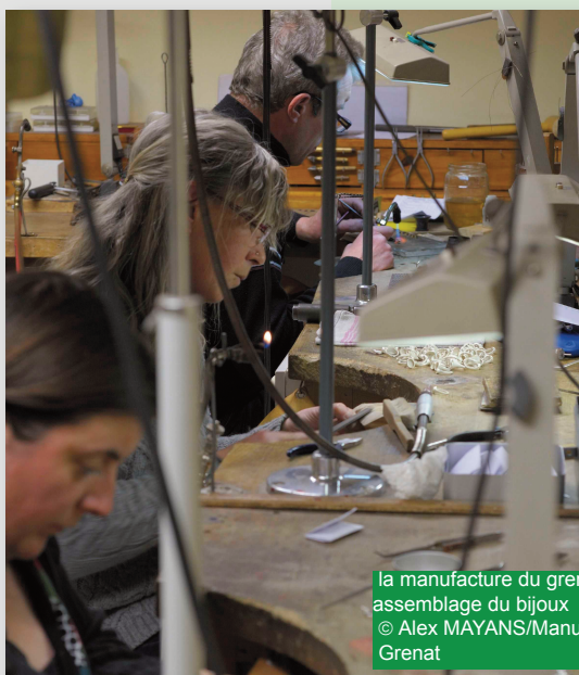
la manufacture du grenat PRADES assemblage du bijou