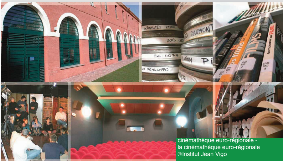
cinémathèque euro-régionale - la cinémathèque euro-régionale

vestibule. Il a été entièrement restauré en 2002-2003.