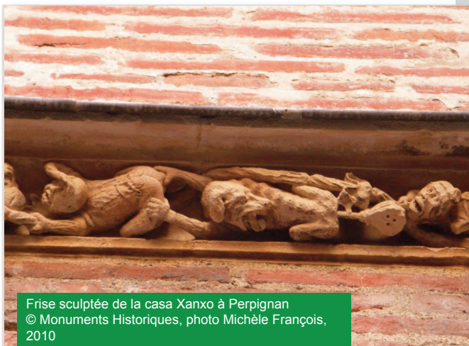
Frise sculptée de la casa Xanxo à Perpignan