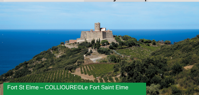
Fort St Elme – COLLIOURE