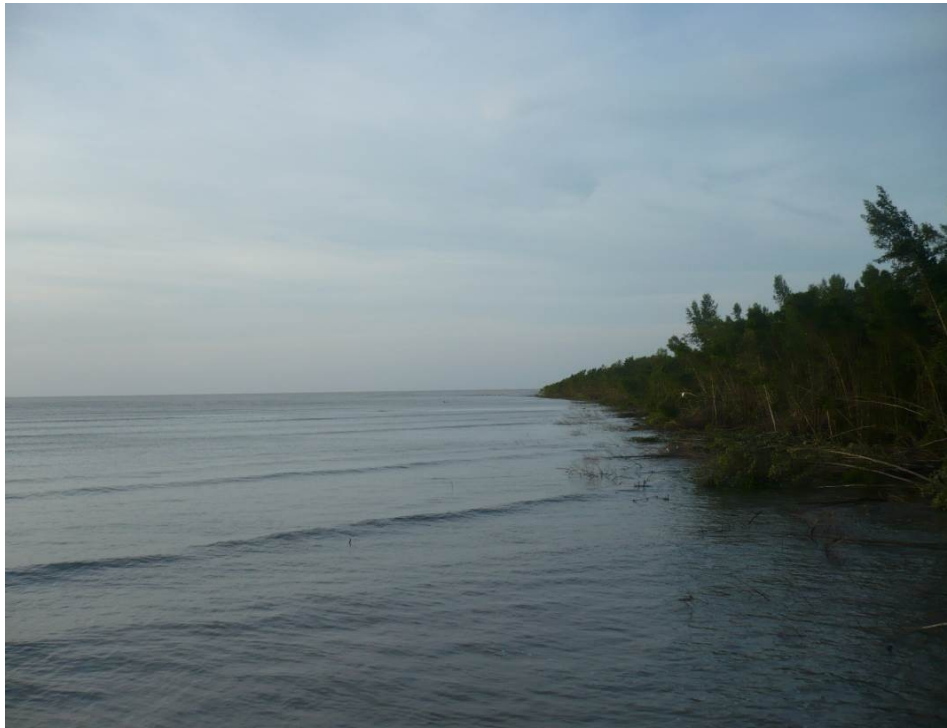
L'avancée de la mangrove sur le fleuve