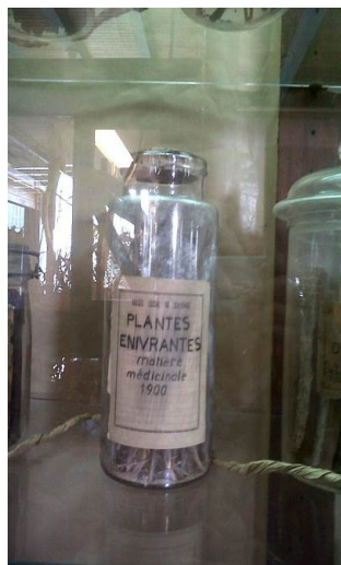
Au musée départemental Alexandre Franconie