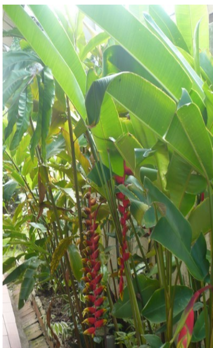
Jardin du musée des cultures guyanaises, Cayenne, 2011.

Nous essayons d'intéresser les professeurs via les médiations et les activités du musée afin qu'ils puissent les intégrer dans leur programme. Régulièrement, nous leur proposons de participer à des médiations sur des thèmes précis, comme par exemple sur les plantes que nous avons remises en culture dans notre jardin.