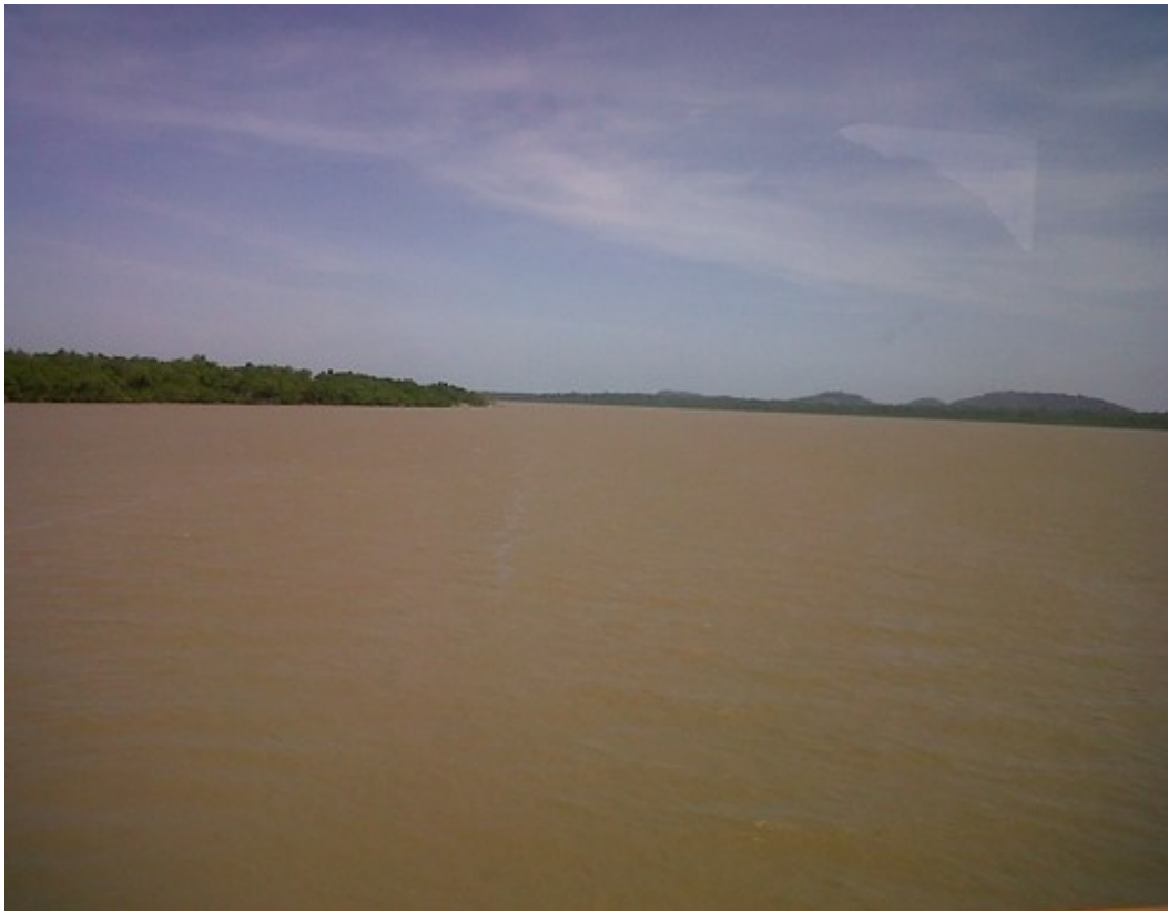
Embouchure du fleuve, Cayenne, 2011