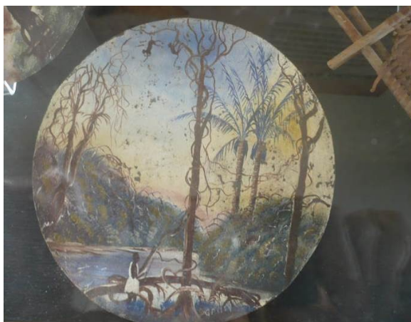
Musée des cultures guyanaises. L'art des bagnards

n'est pas le cas en revanche des missions de mise à disposition du public et de recherche, beaucoup moins évidentes à saisir.