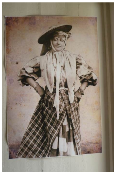
Tenue féminine. Musée des cultures guyanaises

Depuis quelques années, nous nous déplaçons de plus en plus avec des expositions itinérantes, ce qui renouvelle aussi notre propre regard.