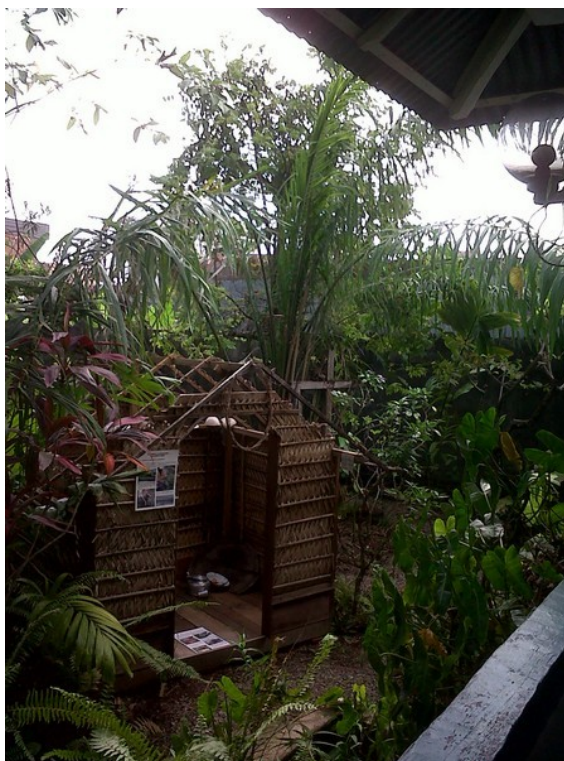
Jardin du musée des cultures guyanaises. Cayenne 2011.