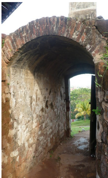
Entrée du fort